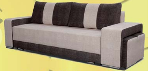
Alka kanapé 2 puffal