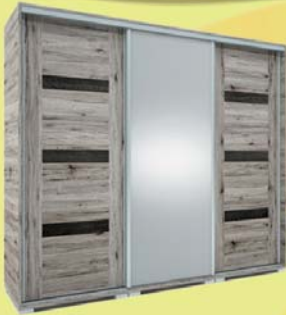
Capri 239 gardrób