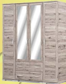
Bern 180 gardrób