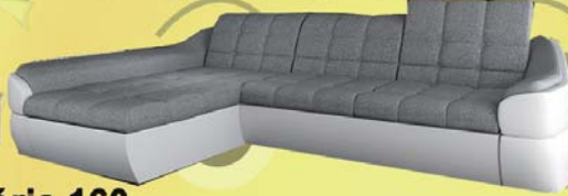
Infinity mini sarok