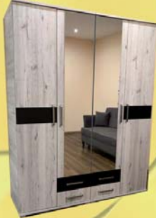
Viktória 160 gardrób