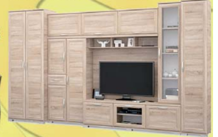
Andora 370 szekrény sor