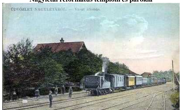
Nagyléta – Vértés vasútállomás látképe