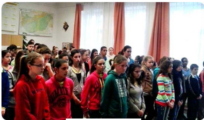
Gyülekezés a szavalásra

Január 22 -én , a Magyar Kultúra Napján, iskolánk felső tagozatos diákjaival együtt csatlakoztunk az „Együtt szaval a nemzet” felhíváshoz, annak tiszteletére, hogy Kölcsey Ferenc 1823-ban ezen a napon tisztázta le Csekén a Himnusz kéziratát.