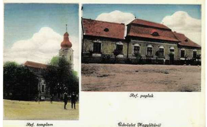
Nagylétai református templom és parókia