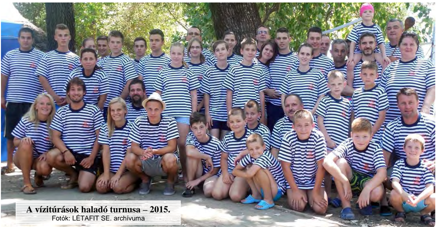
A vízitúrák haladó turnusa – 2015.