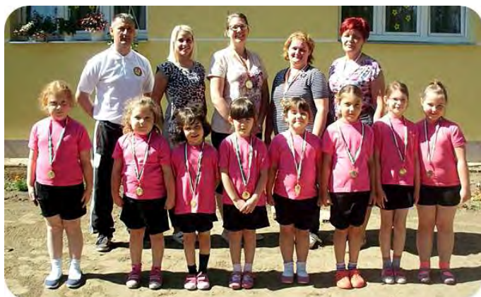
Óvodás kézilabdázó hölgyek