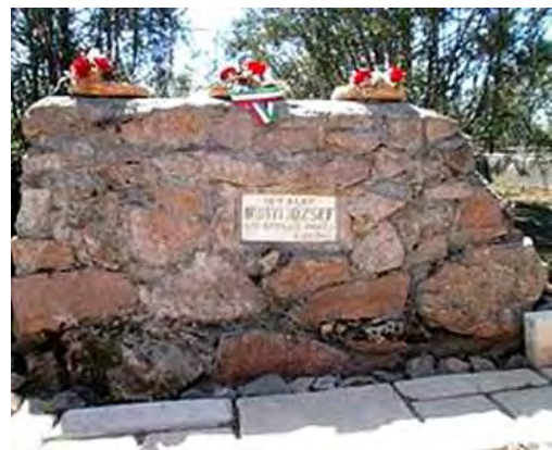
A Bihar megyei Albison, volt szülőháza helyén emléktábla van .

A helybéli lakosság 2001-ben megalakította az Irinyi József Társaság ot.