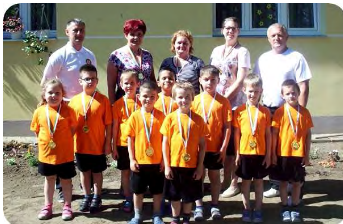
Ovi-focis végzős játékosok az Irinyi utcai tagóvodában