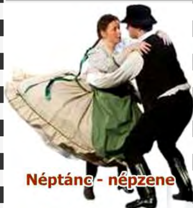
Néptánc - népzene