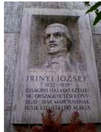
A márciusi ifjú emléktáblája Budapesten

Haláláról Jókai Mór is megemlékezett a Vasárnapi Újságban: „ Irinyi valóban az egész hazai intelligenciának halottja, kinek sírjára annyival nehezebb gondolnunk, mert oda nem egy bevégzett, hanem egy megkezdett munkásság van eltemetve ”.