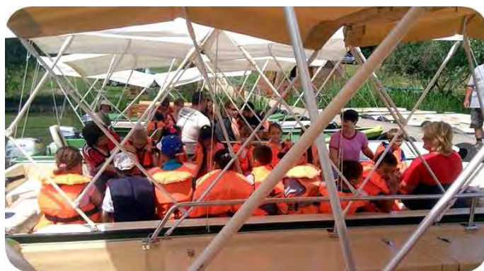
Az 1. évfolyamosok kirándulása

Május végén, június elején minden évfolyam tanulmányi kirándulásra ment. A tanulóink környezetükből kiszakadva saját korosztályuknak megfelelő információk birtokával tértek haza.