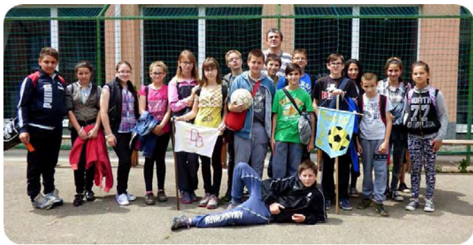
A 6. b. osztály csapata

Ezen a napon játékos akadályversenyen is részt vettek a gyerekek, ahol osztályonként két csapattal indultak. Összesen 8 állomáson kellett helytállniuk a csapatok tagjainak, különböző érdekes feladatokat kellett megoldaniuk, pl. kincskeresés, kúszás, gránáthajtás, mocsárjárás, lajhármászás, pallón járás, lövészet. A gyerekek jókedvűen jártak állomásról állomásra, majd a nap végén a csapatok megkapták megérdemelt jutalmukat. Köszönjük a szervezők munkáját és gratulálunk a nyertes csapatoknak!