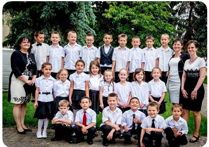
Fotók: Boros Szima Beáta