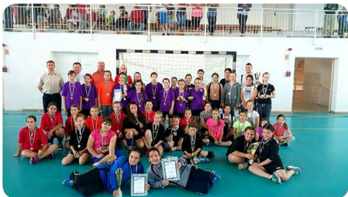
Hazai pályán lett első az U 10-es csapat

U-10 csapatunk hazai pályán, szintén egy négycsapatos tornán első helyezést értek el. Gratulálunk a gyerekeknek a kitartó edzőmunkáért!