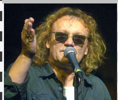
Részletes program a 2. oldalon