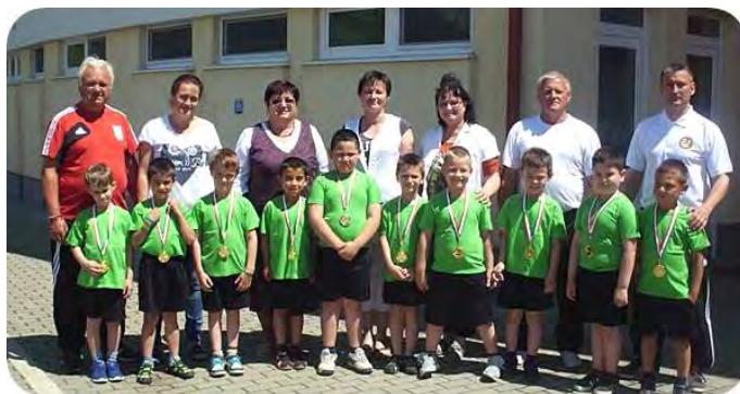
Ovi-focis végzős játékosok a Debreceni utcai óvodában