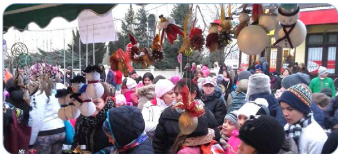
Kirakodóvásár az Irinyi utca elején