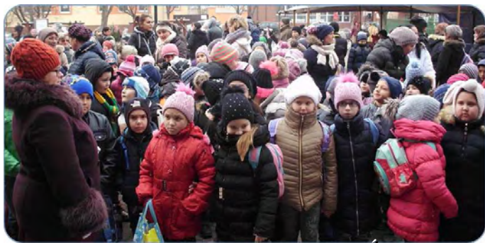
Az ünnepség résztvevőinek egy csoportja az Árpád téren