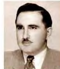
Katona Ferenc (2011)