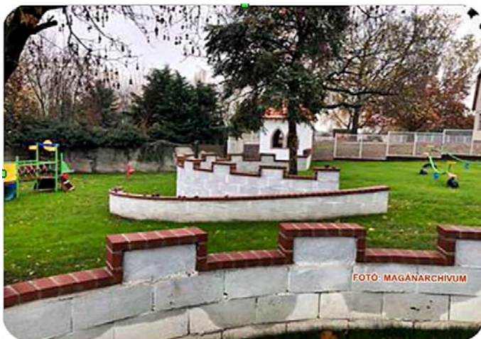
A megújult vértesi tagóvoda udvara

Az Alapítvány Létavértesért kuratóriuma tájékoztatja a lakosságot, hogy az általuk 2018-ban meghirdetett és támogatott pályázatok pénzügyi és szakmai beszámolóit határidőben, 2018. december 01 -ig benyújtásra kerültek. A beszámolókat ellenőrzését követően megállapítást nyert, hogy azok megfeleltek a kiírásoknak és a vállalt kötelezettségeknek.