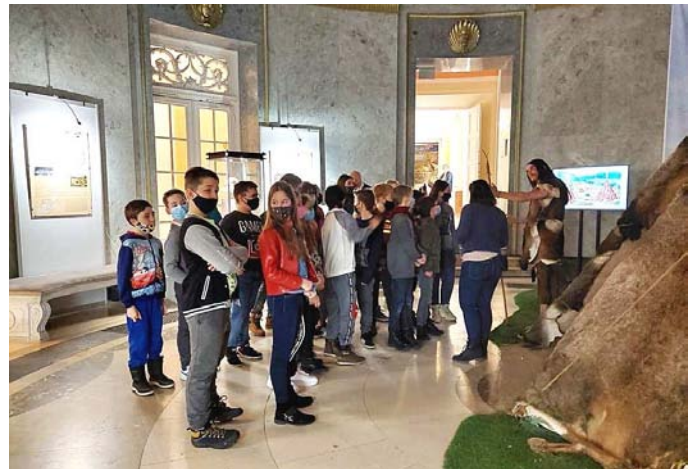
5. osztályosaink a Déri Múzeumban

Tovább folytatódott a Lázár Ervin Program nyújtotta lehetőségek megvalósítása iskolánkban. Ötödikesaink február hónapban a Déri Múzeumba látogattak, ahol a „Csillagok alatt” című kiállítást tekintették meg, és ennek során sok új, érdekes információval bővítették történelmi tudásukat. Ezt követően múzeumpedagógiai foglalkozáson vettek részt. Minden tanulónk feledhetetlen élményekkel gazdagodva tért haza a kirándulásról.