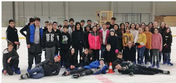
Csoportkép a Debreceni Jégcsarnokban

Az épített jégpályán komoly jégkorongmérkőzések is folytak akkoriban. Sajnos ma már csak a romjai láthatók és az időjárás sem mindig alkalmas a jég készítésre.