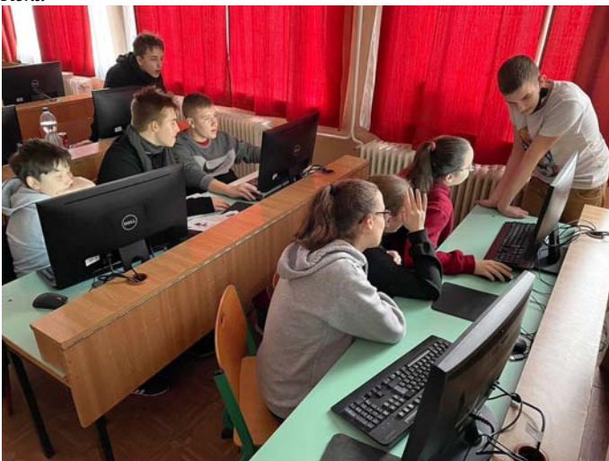
Pillanatkép a versenyen