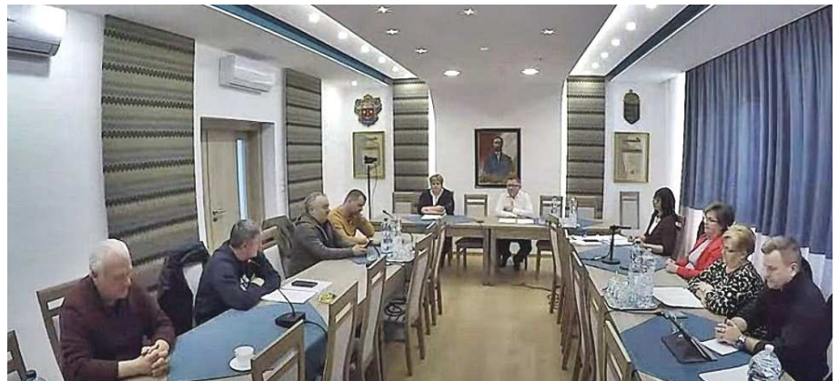
FELVÉTEL: KÖVÁRI KROSZTIÁN

2022. február 17-én megtartott rendkívüli ülés fő napirendi pontja: