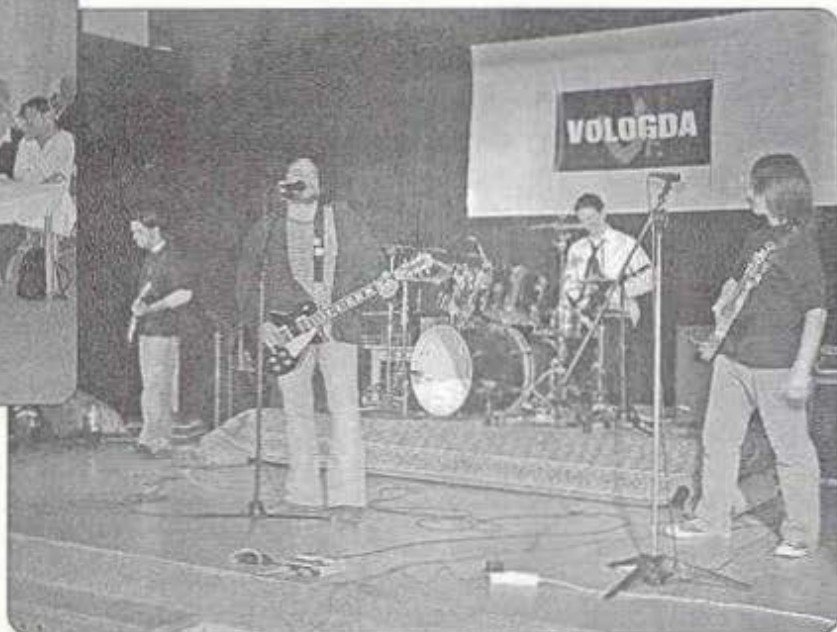
Miénk a színpad 2007. október 27.