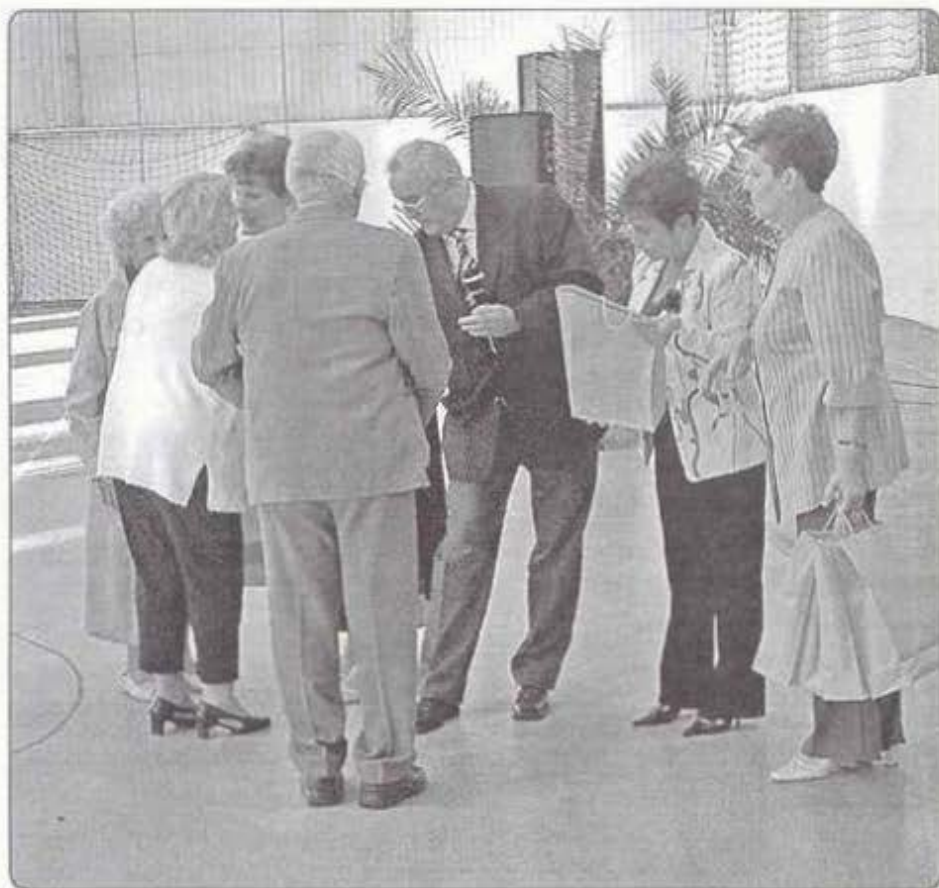
Nemzedékek találkozója 2007. szeptember 15.