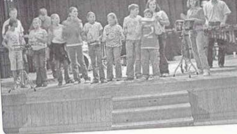
A Miskolci Őtösök koncertjén a hangszereket is kipróbálhatták az alsózsolcai és a pelsőci gyerekek