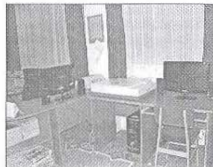
Fogyatékkal élők számára is alkalmas a könyvtár internet hozzáférhetősége

A könyvtári helyiségben a fogyatékkal élők számára elhelyeztünk egy számítógépet, amelyen képernyőolvasó szoftver segíti a vakok és gyengénlátók információhoz való