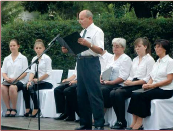
Megemlékezés az I. világháború centenáriumán

amiket a jövő évben Erdélybe látogató zsolcai gyerekeknek bizony meg kell majd mászni!