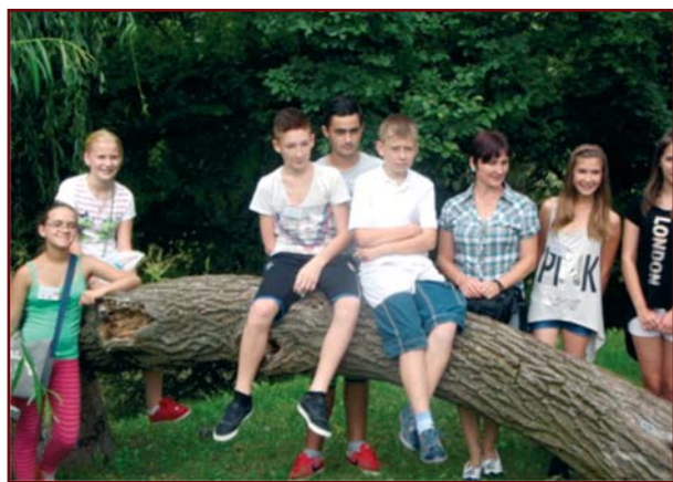
A szentmátéi gyerekek táborozása Alsózsolcán, a kompháznál

Rendezvényektől voltak hangosak a Községi Ház és intézményei, a Sportsarnok és a Helytörténeti Gyűjtemény az elmúlt hetekben. A nyári vakáció kezdetével megkezdődtek a napközis tábori programok, a nyári gyermekfoglal-