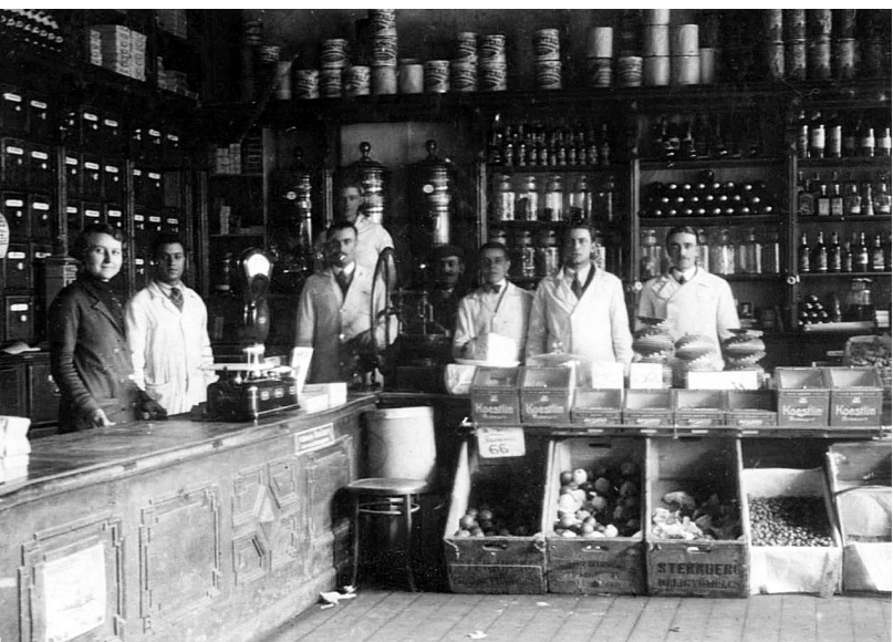
A Schertz-féle nagykereskedés dolgozóit ❖ Hódmezővásárhely, 1933. március 11.

viselnek, melyek színe feltehetően egyforma, a fazon azonban eltérő, mindhárom koszorúslány kalapot is viselt. Frizurájuk is egyforma. Érdekes, hogy a vőlegénynél zsebóra, újdonsült feleségénél pedig karóra volt. Ezek, az emberi élet egyik legfontosabb fordulóján készült képek semmilyen feliratozást