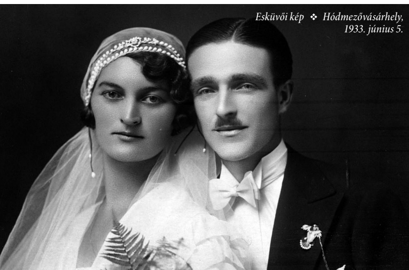
Esküvői kép ❖ Hódmezővásárhely, 1933. június 5.

katonatörténet, mely ehhez az időszakhoz kapcsolódott volna, így a fényképek is csak felszínes információkkal szolgálnak.