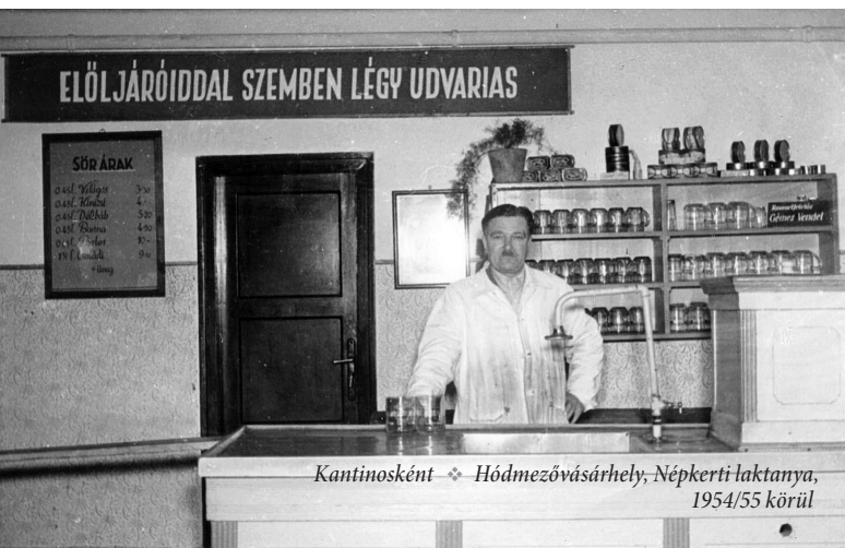
Kantinosként ❖ Hódmezővásárhely, Népkerti laktanya, 1954/55 körül