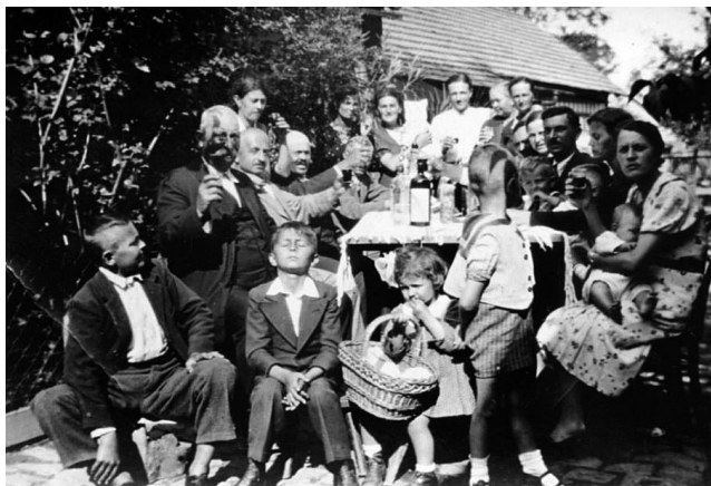
Családi körben ❖ Hódmezővásárhely 1934.

Nem sokkal később már újra a család körében látjuk B.L.-t egy fotón. Egy családi összejevetelről készült a kisméretű, amatőr fénykép. A családi emlékezet szerint leggyakrabban névnapok alkalmával jött össze a család, ekkoriban a születésnapok megünneplése még kevésbé volt bevett szokás. A kép időben való elhelyezését segíti, hogy a fiatal B-né kezében egy pólyás baba, minden valószínűség szerint kisfiuk látható.