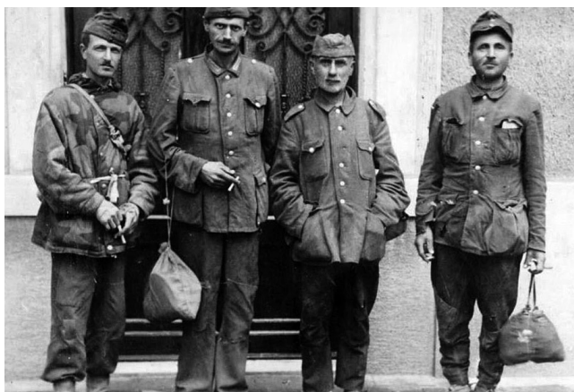
A fogságból visszatérő katonák ❖ Hódmezővásárhely, 1949