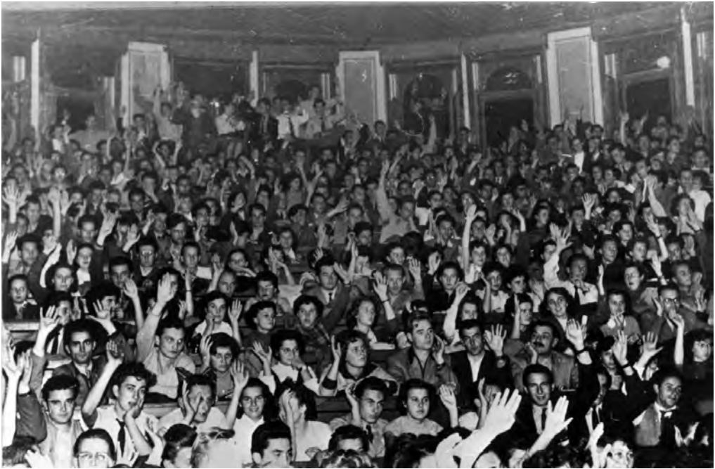
General assembly of AHUCS (University of Szeged, Auditorium Maximum, 20-10-1956) ❖