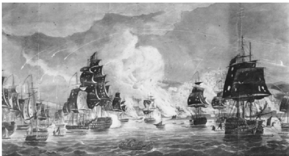
5. ÁBRA ❖ Lord Exmouth flottája az éjszaka során Algírt bombázza 1816-ban. (PANZAC 2005. 285.)

Az észak-afrikai kalózkodás és az oszmánok uralmának végére (kivéve Tripolit, melyet az olaszok foglaltak el 1911-ben) a franciák tettek pontot. A francia monarchia ugyanis X. Károly uralkodása alatt (1824–1830) először Algírt annektálta 1830-ban, majd 51 évvel később, 1881-ben protektorátusává szervezte Tunéziát. (5. ÁBRA)