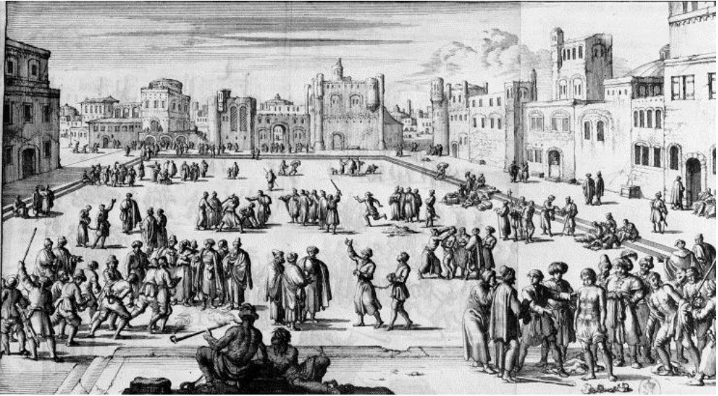
3. ÁBRA ❖ Keresztény rabszolgapiac Algírban. (DAN 1684a. 384. oldalt követően; DAN 1684b)

nem támadhatták meg egymás kereskedőit. Másrészt a szerződésben megengedték a holland hajók átkutatását. Továbbá a holland foglyokat váltságdíj fizetésének fejében szabadon bocsátották. Ezen felül Algírral mindenki szabadon kereskedhetett, és a kereskedelmi termékekre normál adót vetettek ki. A szerződés értelmében azok a holland hajók, melyek idegen lobogó alatt hajóztak lefoglalhatóak voltak. A megállapodás végül szabályozta a mindennapi együttlét kereteit is Algírban. Egyrészt a hollandok és a muszlimok vitás ügyei az algíri díván hatáskörébe tartoztak. Másrészt a holland alattvalók ügyeiben a konzul járt el. 60