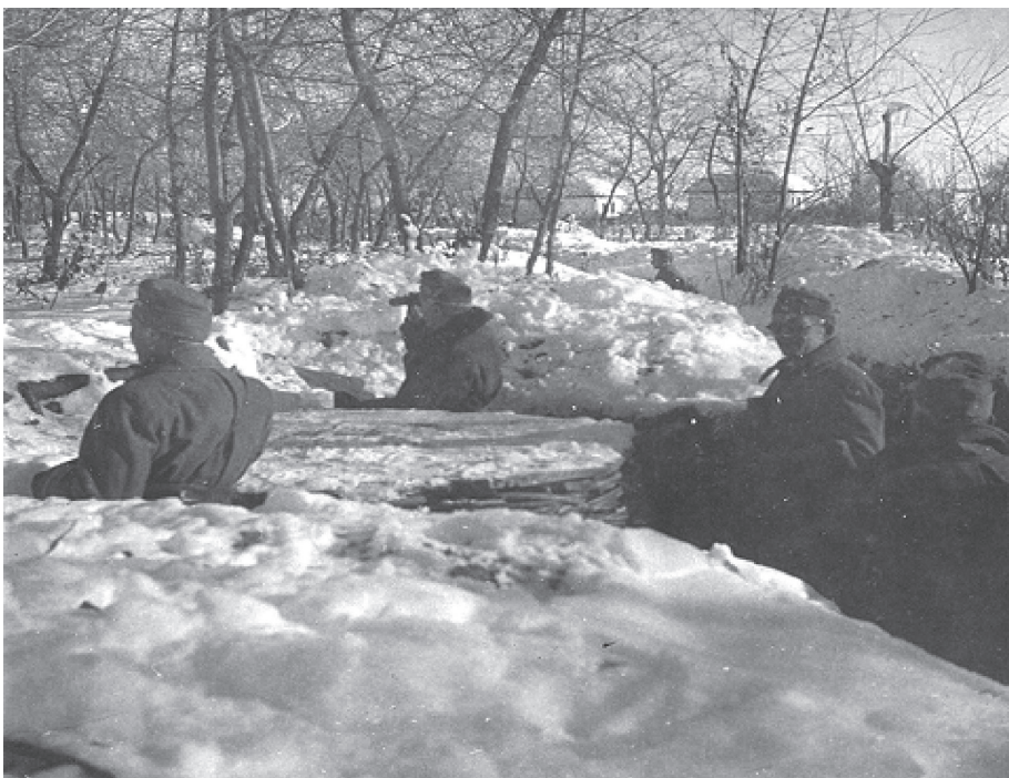
Emberfeletti helytállást tanúsítottak a honvédek a -35, -40 fokos hidegben