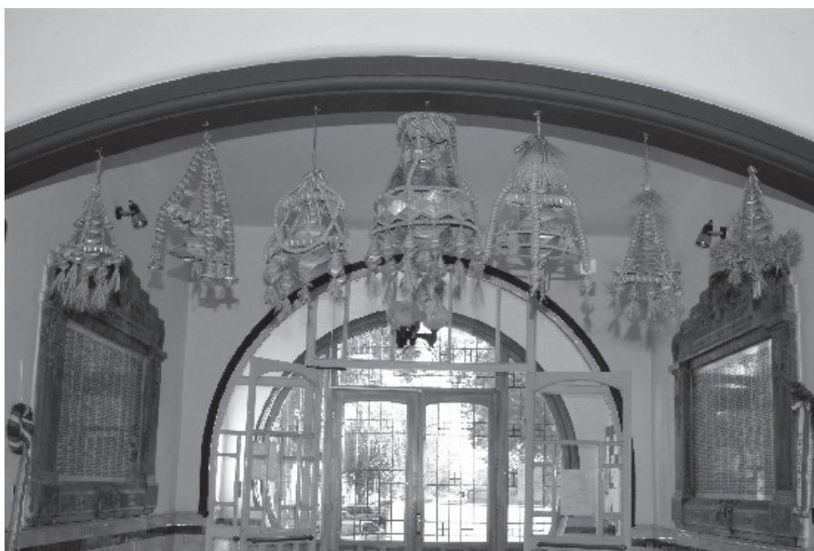
A térség hagyományaira alapozó szalmafonás, a Szalmagaléria eddig is az idegenforgalmat erősítő, a turistákat ide csábító attrakció volt. A kistérségi társulás célja, minőségi szolgáltatást és programot nyújtó turisztikai események szervezése is.