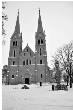
2013-ban szentelték fel 100 éve a Szentháromság Római Katolikus Főtemplomát