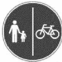
Gyalog- és kerékpárút