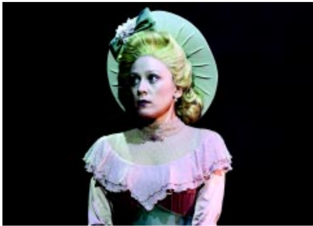
A Pacsirta című előadásban

– Bár Angliában játszódik a történet, mégis van benne