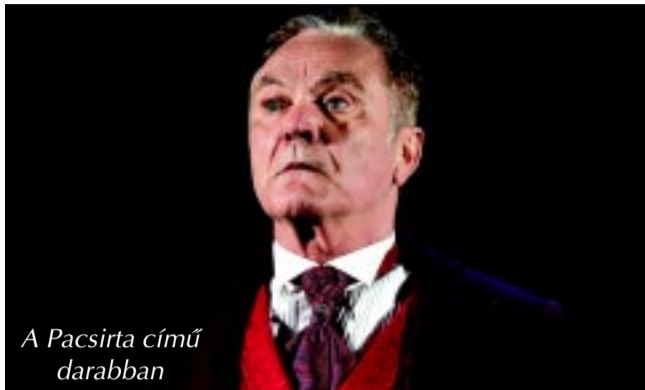
A Pacsirta című darabban