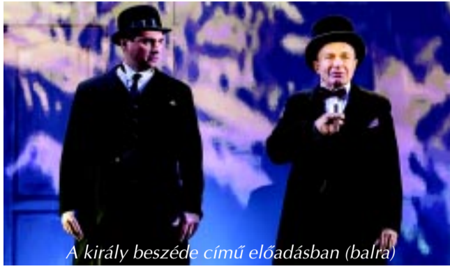
A király beszéde című előadásban (balra)

– Pedig nem tett semmi rosszat, de – talán tiszteletből, udvariasságból – nem is akarja a szülők szemébe monda-