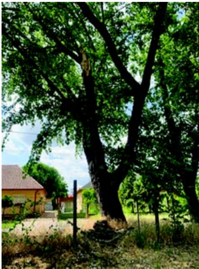
Ágletörés a Csáktornya utcán. Komoly veszélyt jelenthetett volna.

A gyors növekedésnek ára van. Az ezüst juhar és a nyárfák faanyaga puhább, kevésbé tartós, mint a lassabban növő fajoké. Ezek a fák általában nem érik meg a száz évet – gyakran már 30–40 éves korukra elkezdnek elöregedni. A törzsek belül korhadnak, a nagy ágak statikailag instabillá válnak, és a fa már nem tud megbirkózni a természet erőivel. Ráadásul a klímaváltozás következményei, mint az egyre gyakoribb és erősebb viharok, heves szellőkésések és jégesők, tovább növelik a fák veszélyességét. Egy-egy viharos napon nem ritka, hogy hatalmas ágak törnek le, vagy teljes fák dőlnek ki – gyakran autókra, házakra, esetenként akár emberekre is. Pedig ezek a fák egykor megoldást jelentettek – ma viszont gyakran problémát.