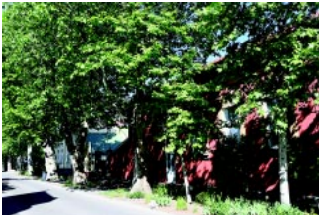
Kiss Ernő utcai platánfasor, melyet pár éve ifjítottak