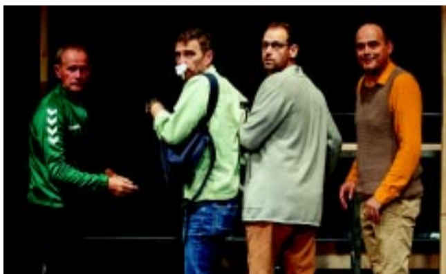
Kép a „Még egy kört mindenkinek” című előadásból, amelyet az Orlai Produkciós Iroda mutat be augusztus 24-én 20 órától a Rózsakert Szabadtéri Színpadon