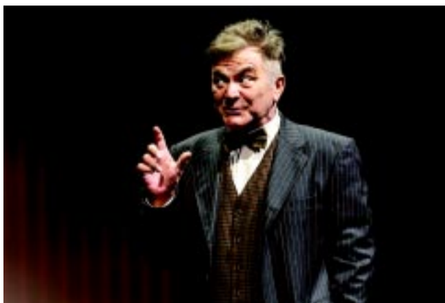
A király beszéde című előadásban

– A kettőt nem lehet különválasztani, a személyiségét nem lehet elkülöníteni színésznői kvalitásától. Egyébként szerintem ez jellemző a színész magánéletére is. Annak idején a nyolcvanas években volt egy kötet, benne Popper Péter írásával a színészekről: bohóc és mágus stb. Tankönyvként használtuk. Meglepődve láttam, hogy olyan magyarázatok születtek: teljesen mindegy, milyen emberként, az nem érdekes, az a lényeg, milyen színész. Én akkor olyan húsz év körüli fiatal voltam, teljes meggyőződéssel mondtam, hogy ez nem igaz, ez nem lehet, én másként tapasztalom. Az, akinek a személyisége emberileg olyan szinten van, amit nem lehet kedvelni, az a színész engem taszít a színpadon is. Mert ott állva is látszik, érződik a