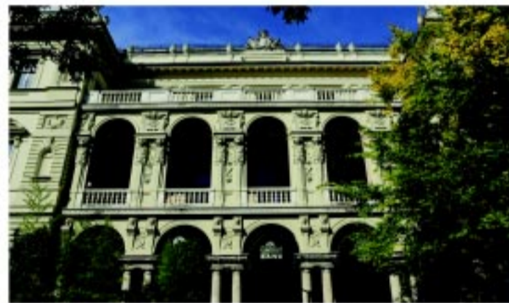
MagNet Székház