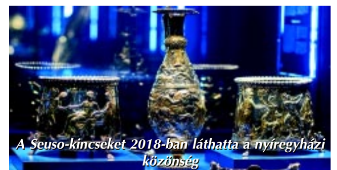
A Seuso-kincseket 2018-ban láthatta a nyíregyházi közönség

Mindennek előzménye, hogy az önkormányzat korábban is rendelkezett már támogatói szerződéssel a TOP programban a fejlesztésre (nettó 2,8 milliárd forint értékben), ezért is indult el a 2022. január végi bezárást követően a költözés, átszervezés és a felújítás előkészítése. Ám a projektben tervezett beruházás akkor ellehetetlenült a kivitelezési költségek emelkedése miatt, ezért az önkormányzat elállt a megvalósítástól. Az a támogatási jogviszony 2023. november végén szűnt meg, és noha a kivitelezésre vonatkozó közbeszerzési eljárások lezajlottak, azonban forráshiány miatt eredménytelenül zárultak. Ám mindez fontos alapot jelent a mostani pályázathoz, hiszen a korábbi, TOP 2021-es pályázathoz elkészült tervek felül-