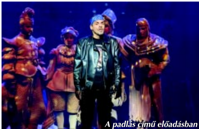
A padlás című előadásban

– Azt tudni kell, hogy az én szerepem nagyon kicsi, alig-alig fordulok meg a színpadon, néha csak pár másodpercet töltök ott, máskor jó néhány percet. Az öreg hivatali szolgát, Ferapontot játszom. A próbafolyamatban így kevésbé vettem részt, mint a sokkal nagyobb szerepekkel bíró kollégáim. De, amiben részt vettem, úgy éreztem, hogy értékes, hasznos és jó próbafolyamat volt.