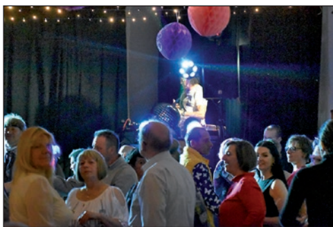
Cserkészbál a Zenálkóban