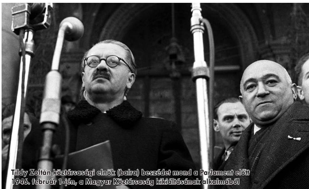
Tildy Zoltán köztársasági elnök (balra) beszédet mond a Parlament előtt 1946. február 1-jén, a Magyar Köztársaság kikiáltásának alkalmából

1945 decemberében és 1946 januárjában hosszas aggályoskodások és viták után a koalíciós felek elfogadták a köztársaság eszméjét. A nemzetgyűlés 1946. január 31-én elfogadta a királyság megszüntetéséről és a köztársaság megteremtéséről szóló 1946: 1. törvénycikket. A köztársasági elnök jogkörének meghatározásakor azon álláspont győzött, hogy gyengébb elnöki jogköröket állapítsanak meg: az elnök 15 napon belül kihirdetni tartozott a törvényeket, a Nemzetgyűlést 30 napra elnapolhatta, a képviselők kétharmadának indítványára fel is oszlathatta. Képviselte