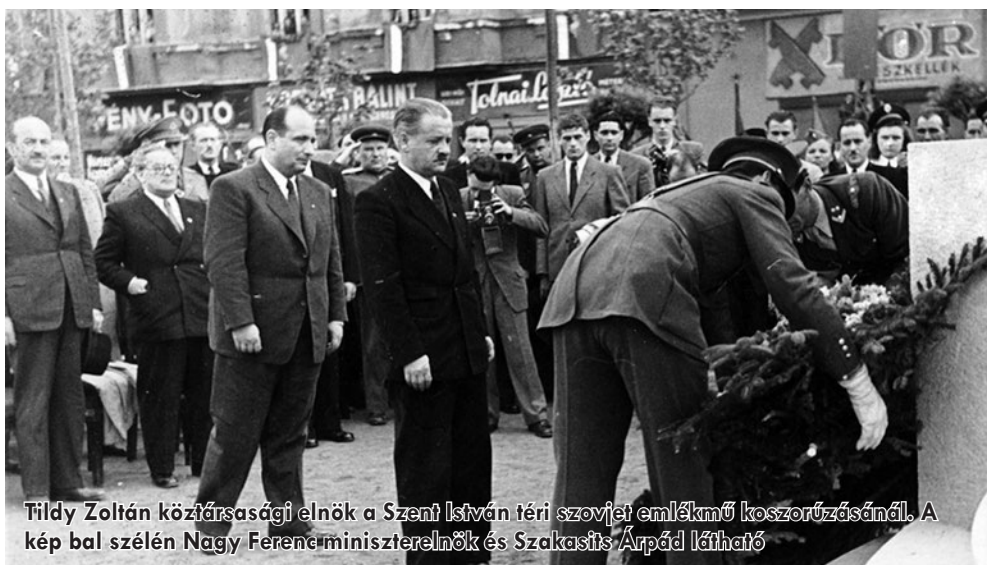
Tildy Zoltán köztársasági elnök a Szent István téri szovjet emlékmű koszorúzásánál. A kép bal szélén Nagy Ferenc miniszterelnök és Szakasits Árpád látható

Az 1946. január 31-én elfogadott köztársasági törvény szavatolta a demokratikus szabadságjogokat is: „Az állampolgárok természetes és elidegeníthetetlen jogai különösen: a személyes szabadság az elnyomástól, félelemtől és nélkülözéstől mentes élethez, a gondolat és vélemény szabad nyilvánítása, a vallás szabad gyakorlása, az egyesülési és gyülekezési jog, a tulajdonhoz, a személyi biztonsághoz, a munkához, és a méltó emberi megélhetéshez, a szabad művelődéshez való jog, s a részvétel joga az állam és az önkormányzatok életének irányításában”. (Hiányosság volt, hogy külön törvényekben nem kodifikálták, konkrétan mit jelentenek az egyes alapjogok.)