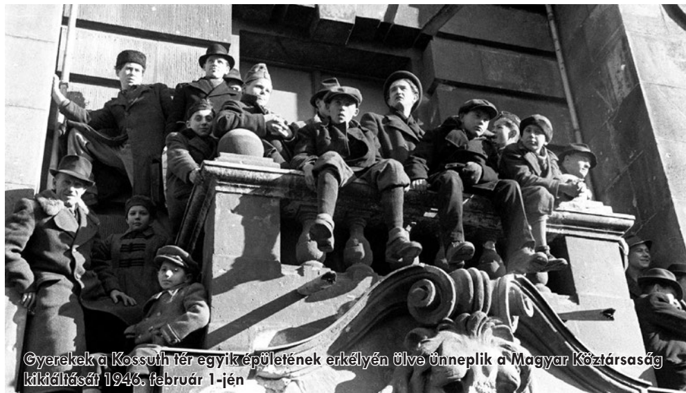
Gyerekek a Kossuth tér egyik épületének erkélyén ülve ünneplik a Magyar Köztársaság kikiáltását 1946. február 1-jén

A jelenben nem a korábbi, sok évszázados Magyar Királysághoz, annak területi nagyságához kellene hasonlítani Ma-