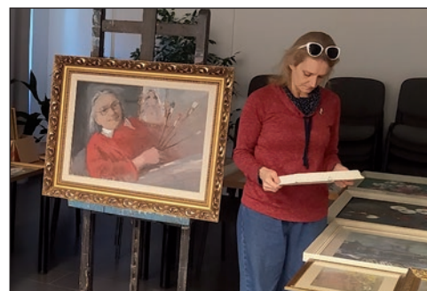
Márton Béla programsorozat...