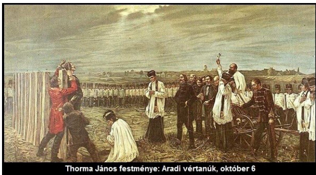
Thorma János festménye: Aradi vértanúk, október 6.

1849 október 6-án a majdnem egy éven át tartó szabadságharc befejezését követően az ifjú Ferenc József császár súlyos büntetés kiszabásával akarta megüzenni a magyaroknak: birodalmában nem tűri a lázadást. A császár tizenhárom magyar honvédtábornokot ítéltetett halálra, mindegyiküket nyilvános és megszégyenítő kivégzéssel sújtva.