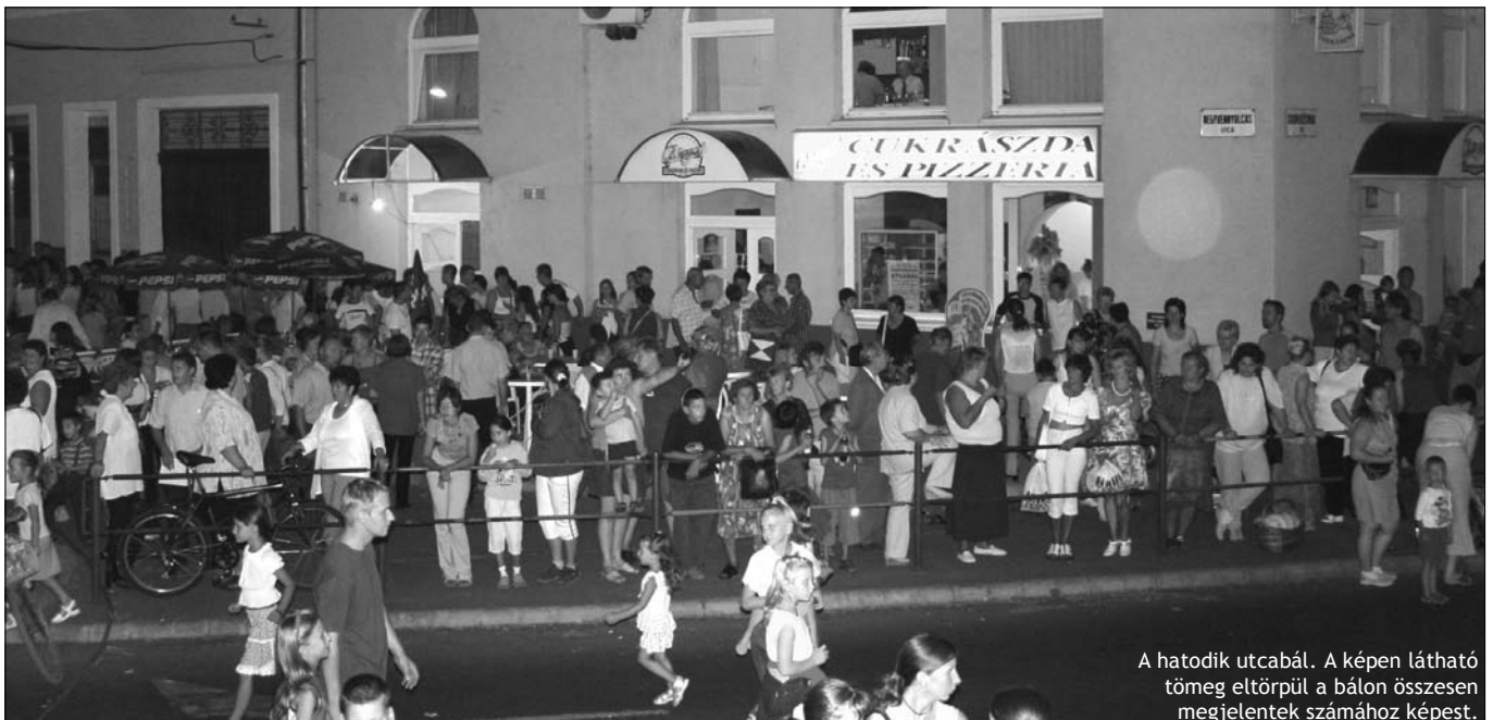
A hatodik utcabál. A képen látható tömeg eltörpül a bálon összesen megjelentek számához képest.