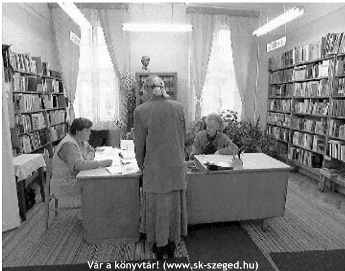
Vár a könyvtár! (www.sk-szeged.hu)