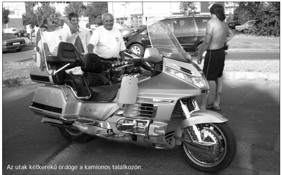
Az utak kétkerekű ördöge a kamionos találkozon.