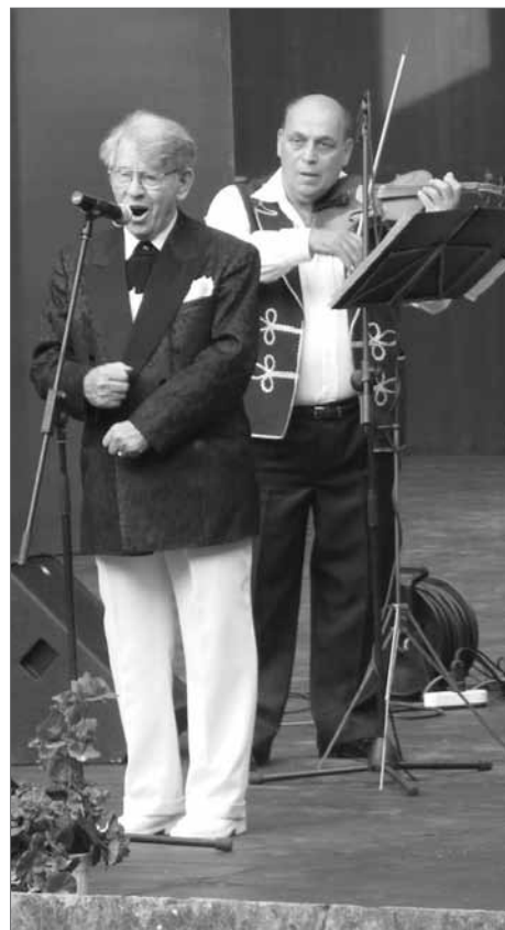
Fellépés az Újszegedi Szabadtéri Színpadon

Negyven éves tanári pályafutásából 38 évet Kiskundorozsmán töltött, 1992 óta nyugdíjas. Szívesen énekel népdalt, műdalt, népies dalt, nótát, sláger- és nosztalgia-dalokat, Petőfi Sándor költeményeinek megzenésített