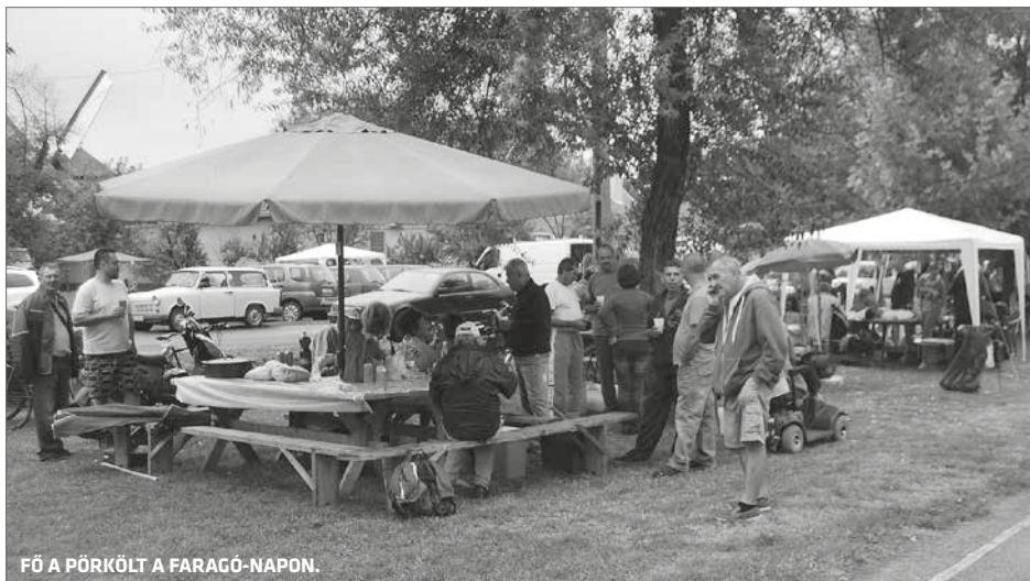
FŐ A PÖRKÖLT A FARAGÓ-NAPON.

A fesztivál ideje alatt szeretnénk kérni a lakosokat tökök felajánlására. A legtöbb tököt behozó családot étkezési jeggyel jutalmazzuk. A nap végén a behozott tököket visszaszolgáltatjuk.