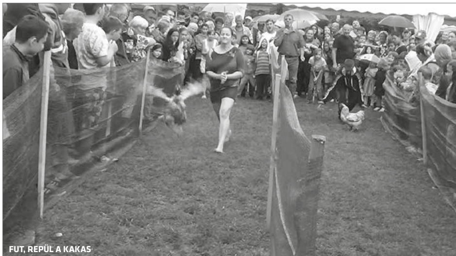
FUT, REPÜL A KAKAS