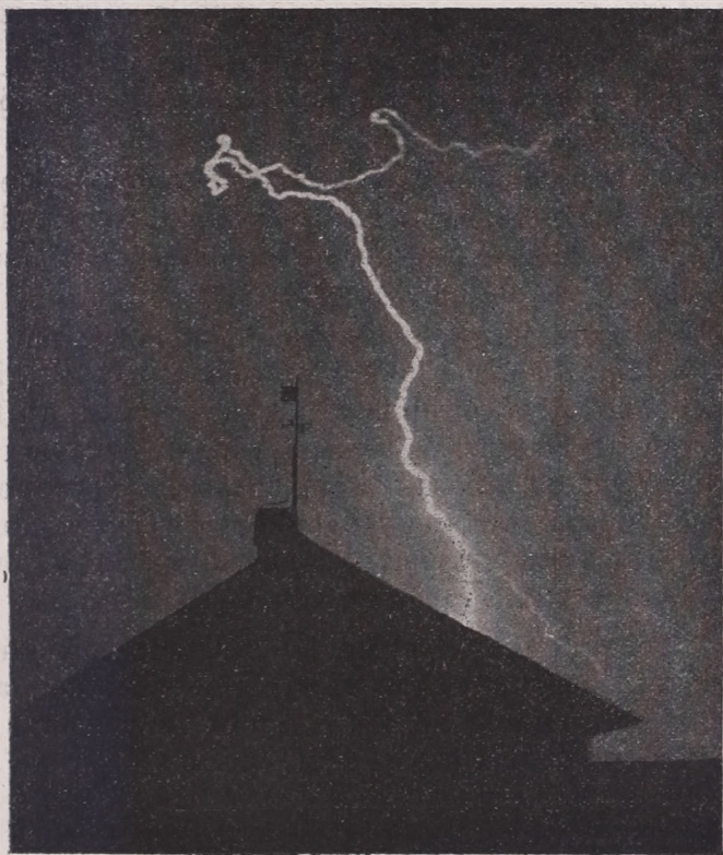
Lecsapó (vonalas) villám.

ifj. Lakner László felvétele Génye pusztán (Bars vm.) az 1898 jún. 22-iki éjjeli zivatar alkalmával.