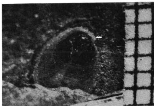
3. sz. kép: Acanthoides gracilis var. Bendai bőrfoga.