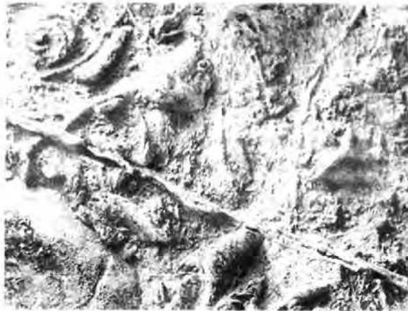
4. ábra: Palaeechinus globosus JACKSON IA (interambulakrális) -tábla (Nagyítás: 3 x)