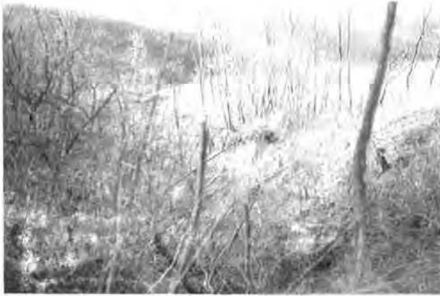
1. ábra: Mályinka, Felsőszőlőköve, Piszepatak völgye Echinoideás lelőhely (felső-karbon)