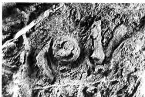
5. ábra: Palaeochinus globosus JACKSON primer túske (Nagyítás: 3 x)