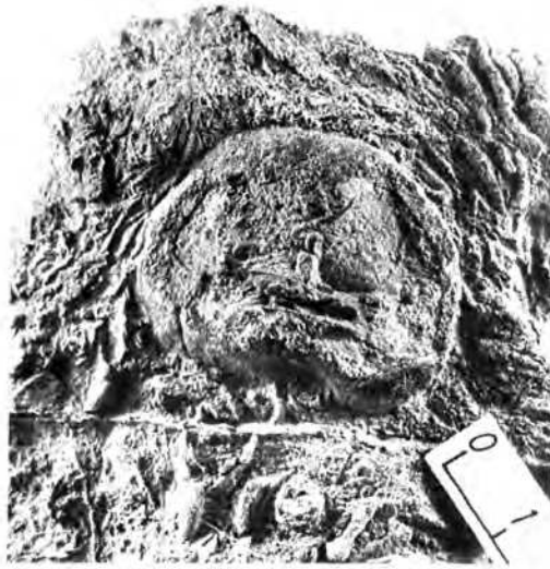
3. ábra: Palaeechinus globosus JACKSON vázkeresztmetszet (Nagyítás: 2x)