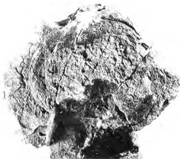
6. ábra: Palaeochinus globosus JACKSON vázkeresztmetszet és interambulacralis táblya (Nagyítás: 2 x)