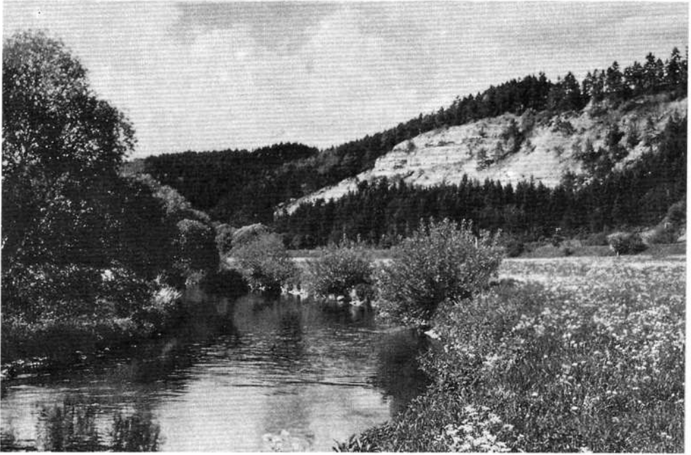
Das Verra Tal bei Leutersdorf