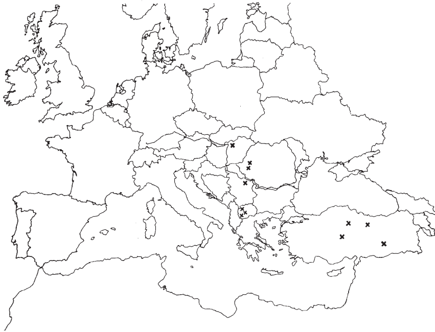
1. sz. ábra – A európai gyűjtésekből származó Phyllomorpha laciniata gyűjtőpontok(X)

( Az Északi Középhegység gyűjtőpontjai )