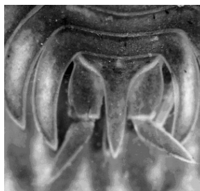
1–3. ábrák: Oniscus asellus Linnaeus, 1758: 1 = habitus, 2 = fej, 3 = telson