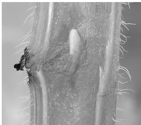
2. számú fotó: Pilemia tigrina petéje a tápnövény szárában

A kikelő lárvák először a szárban, majd lefelé haladva a szártőben és gyökerében rágnak és gyorsan növekednek. A bábozódás minden bizonnyal az év őszén megy végbe a gyökérben, és a faj imágó alakban telél át. Közeli rokonainál ( Cardoria , Musaria , Phytoecia , Opsilia ) is így történik a kifejlődés. Az imágók megjelenése egybeesik a tápnövény virágzásának kezdetével, általában április vége, május eleje. Az irodalomban publikált legkorábbi adat április 21. (1934). Mint a cincéreknel általános először a hímek bújnak elő, s néhány nap múltával követik őket a nőtények. Mind a hímek, mind pedig a nőtények a tápnövényen található, itt történik párzásuk is. Napsütéses időben fűgén szaladgálnak a kék atracél szárán, levelein és virágzatán. A cincéreket színezetük és szőrözöttségük – mely a virágzathoz hasonló – jól beleilleszti a környezetbe. Zavarásra vagy repülve menekülnek el (már több méterről észreveszik a közeledő embert), vagy ha már nincs idejük szárnyra kapni ledobják magukat a földre, ahol rövid ideig holtan tettetik magukat, majd igyekeznek elbújni. A hímek egyik növényről a másikkra repülve keresik párjukat. Az „érdeslevelű” tápnövényen való mozgásnak köszönhetően a rajzás végén már igencsak megkopott szőrzetű példányok találhatóak. A rajzás ideje nagyjából egy hónap, ez idő alatt a cincérek a tápnövényük epidermisztét fogyasztják táplálékkul. Az utolsó imágót már elszáradt virágzatú növényen, június 16-án (1998) sikerült megfigyelni.