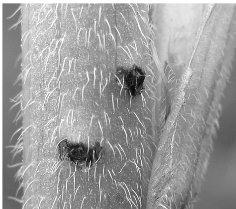
1. számú fotó: Pilemia tigrina rágásnyoma a tápnövény szárán

A faj életmódjával kapcsolatos ismereteket a szerző 1996–1997-es és 2004-es – a Körös-Maros köze területén végzett – kutatásai szolgáltatották: A megtermékenyített nőtény a tápnövény szárába petézik, úgy, hogy először lyukat rág a szöveteken keresztül, majd e lyukon át bevezetve tojócsövét a petét a védett belső részbe helyezi – hasonlóan, mint ahogy az a Cardoria scutellata esetében történik (lásd: KOVÁCS 1989). A rágás nyomai a későbbiekben jól látszanak (1. számú fotó), s így rossz időjárási viszonyok közt – amikor az imágók elbújnak – illetve a rajzás végeztével is bizonyíthatjuk a cincér jelenlétét a szárban levő pete (2. számú fotó) vagy lárvá megtalálásával. E nyomok a talajtól számított kb. 10 és 65 cm közé esnek. Egy szárban csak egy-két pete kerül, hogy a növekvő lárvák ne rágják meg egymást, valamint, hogy a tő ne pusztuljon bele a rágás okozta károsodásba. A cincér és pete méreteinek arányából valószínűsíthető, hogy egy nőtény csupán néhány pete lerakására képes.