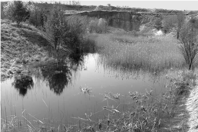
4. kép A Hercegekövesi kvarcit-bentonit bányában kialakult tó, burjánzó növényzettel (Szlabóczky P. 2006. április)