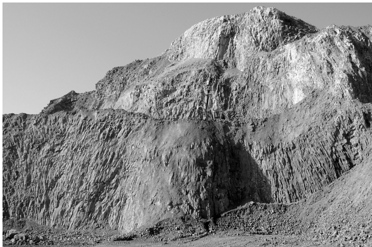
1. kép Tállyai andezit bánya kráter alatti egykori magmacsatorna sárgászörös elbontódott és utólag befelé dőlő szürke, repedezett lávatömegei (Szlabóczy P. 2006. április)

A tállyai Kopasz-hegyen a 60-as évektől kialakult és nagy területén ma is működő nagyüzemi bányaudvar, egy geomorfológiailag jól lehatárolódó, az egykori több száz méter vastagságú tufás fedő alól kipreparálódott andezites szubvulkán (ELEK I. 1969) központi (kráter alatti) magját – hazánkban páratlan módon – még megtekinthetjük. Az 1. képről kivehető a folyamatos robbantást előkészítő fűrőberendezés. Félő, hogy néhány év múlva ezt a csodálatos geológiai szerkezetet már nem láthatjuk, hasonló sorsra jut, mint uzsabányai meddő kőzetű krátertömeg. A kb. 100×50 m-s profilú feltárás széleiről befelé dőlő törérendszerű megszilárdult lávatömeg mutatja a vulkáni benyomulás végén történt magmakamra visszasüllyedést. A felnyomulás központi kőzete nagy tömegekben elbontódott az utóvulkáni tevékenység miatt. A lávamag szélein erősen agyagásványosodott utóvulkáni telérek, illetve sötét-szürke későbbi benyomulások mutatják az egykori 1500 °C-os vulkáni magma belső szerkezetét.