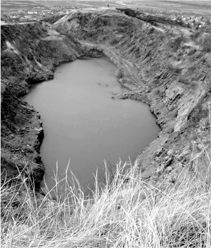
3. kép Tengerszem a Tarcali Fűhrer bányában (Szlabóczky P. 2006. április)