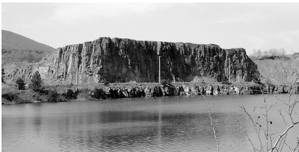
2. kép Erdőbénye, Mulató-hegyi bányató, háttérben a robbantási kőzetpillérrel (Szlabóczy P. 2006. április)