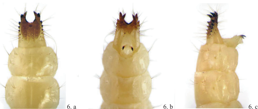
4–6. ábra. 4. Hypoganus inunctus , 5. Ischnodes sanguinicollis , 6. Lacon querceus lárvájának potrohvége; a. felülről, b. alulról, c. oldalról

50%-a. Társfajai: Dendroleon pantherinus /Myrmeleontidae/ (2), Gnorimus variabilis , Tenebrio opacus (2). A mátrai lelőhelyei 151–734 m magasságban található (Kisgombosi-legelő, illetve Cserepes-tető). Általában szárazabb odúkból él, az ilyenekben akár számos példány is fejlődhet: a Kisgombosi-legelőn januárban 21 két korosztályú lárvát találtunk és egy imágót, míg a parádi Várhegyen májusban 19 imágót. A kirajzott állatok alkonyatkor aktívak (NÉMETH & MERKL 2009). Adataiból 2 lárvára, 5 pedig imágóra vonatkozik.