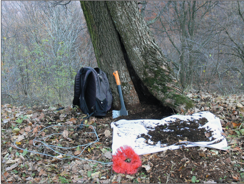
10. ábra. A Pseudanostirus globicollis lárvájának lelőhelye: mezei juhar odújának bejárata a parádsasvári Csőr-hegyen (717 m)

a nedves talajban, 5 cm mélységben. Ez azt valószínűsíti, hogy a nőstények idős odvas fák ( Acer campestre , Fagus sylvatica ) tövéhez petéznek és a lárvák, ha nem is az odúban, de annak közvetlen környezetében a nedves talajban fejlődnek ( Acer campestre ). Bár Fagus sylvatica tövében még nem találtunk lárvát, feltételezzük, hogy ez a faj is tápnövénye a gömbnyakú pattanónak, mivel a mezei juhar odvainak száma a területen alacsony az imágók megfigyelt példányszámához képest. Adataiból 1 lárvára, 6 pedig imágóra vonatkozik.