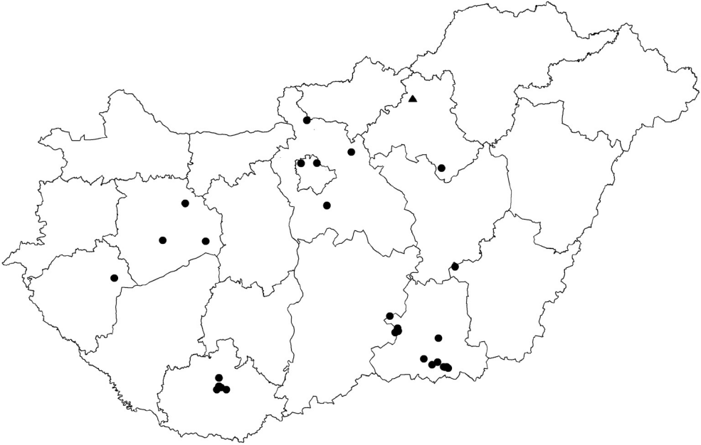
1. ábra. Dixus clypeatus (Rossi, 1790) magyarországi lelőhelyei; ● = irodalmi adat, ▲ = új adat