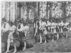
KIS TÁNCOSNŐK HÍMEZNI TANULNAK