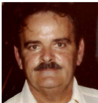
Payer Lajos 1929 – 2016