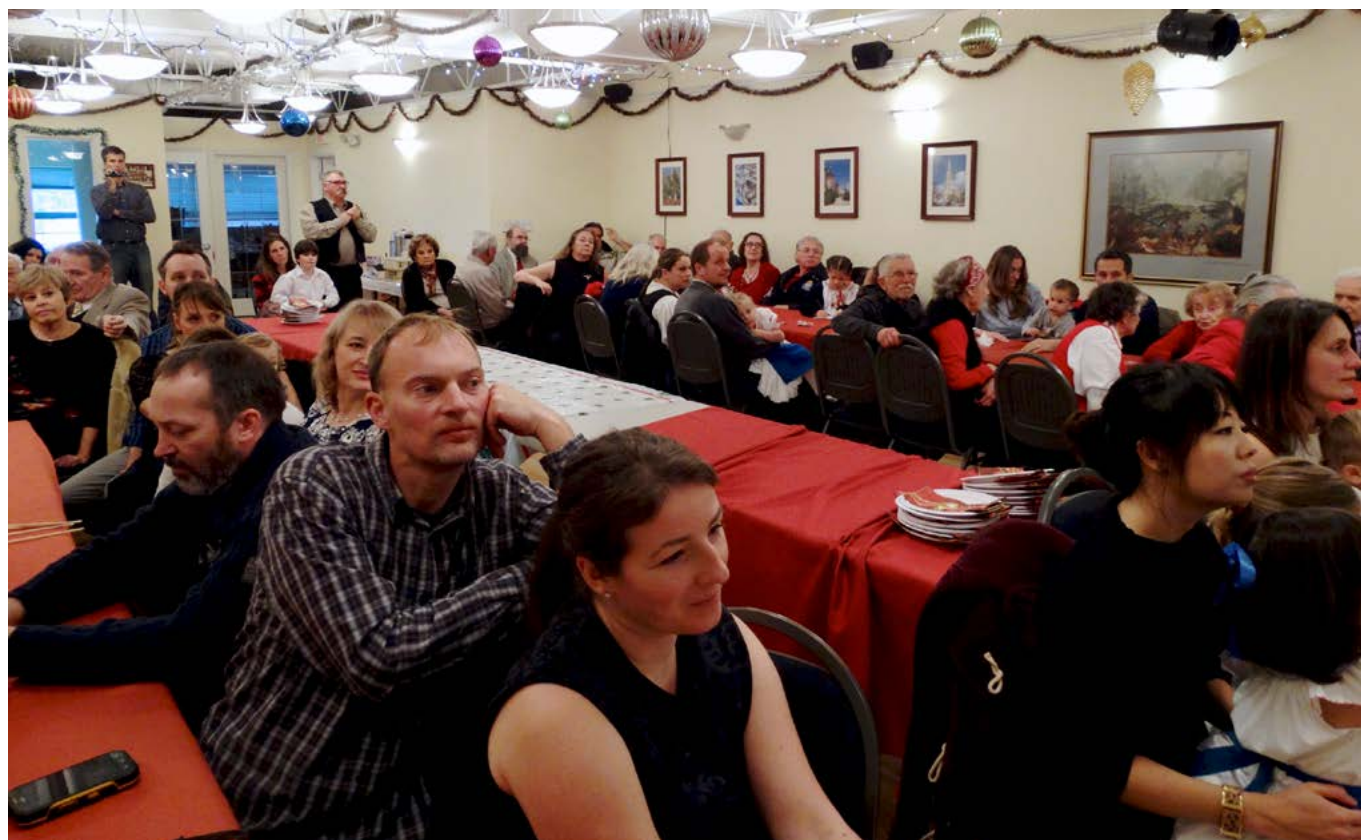
■ A Mikulás délután ismét telt házzal zajlott le.

tanulása, hanem a magyar kultúra iránti szeretet kialakítása. Ha ezalatt a kilenc hónap alatt, amíg ezekkel a gyermekekkel foglalkozhatok, annyit elérek, hogy maradandó, pozitív emléket hagyok bennük a magyar iskolával, nyelvvel és kultúrával kapcsolatosan, akkor azt hiszem sikerült azt a kis elültetett szeretet-magocskát kicsíráztatni... Ez pedig később kivirágozhat, ami abban fog megnyilvánulni, hogy felnőttként majd ők lesznek azok, akiknek igényük lesz arra, hogy fenntartsák, programokkal töltsék meg a Victoriai Magyar Házat. ❖