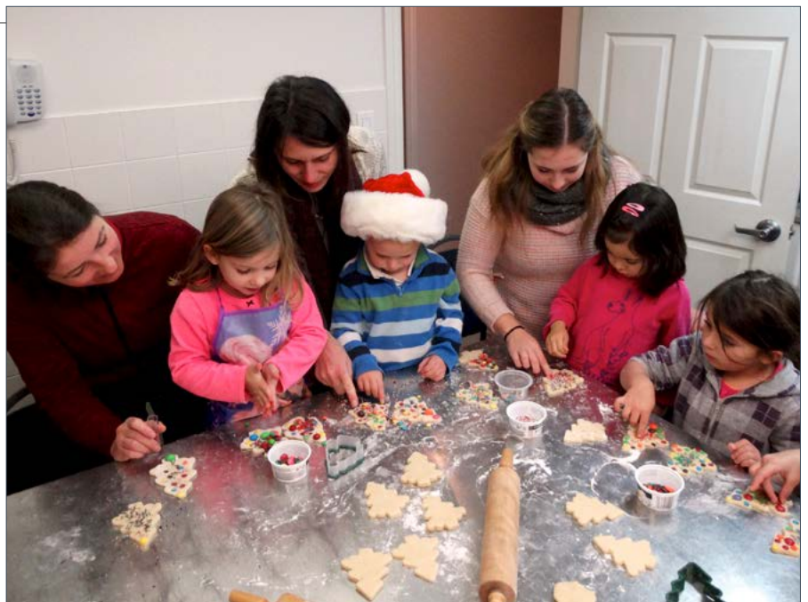
■ Karácsonyi sütés a klub konyhájában a gyerekekkel.

A diaszpórában élő magyar közösségek fenntartása az újabb generáció segítségével lehetséges. A legfiatalabbak magyar identitásának kialakítására, erősítésére pedig a magyar iskolák foglalkozásai, programjai adnak esélyt. Mi és mekkora a szerepe a pedagógusnak? Mire van szükségük a gyerekeknek: egy újabb iskolapadra vagy egy önfelelt játékos hétvégére? Milyen életkorú a ka-