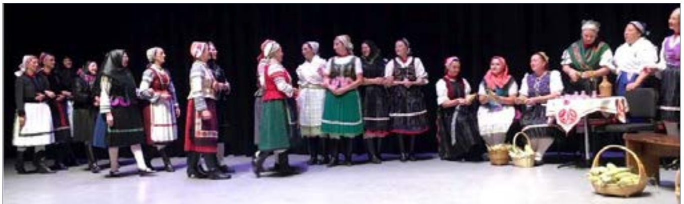
■ Zoborvidéki Asszonyok

To add to the weekend enjoyment there was táncház every evening, featuring live