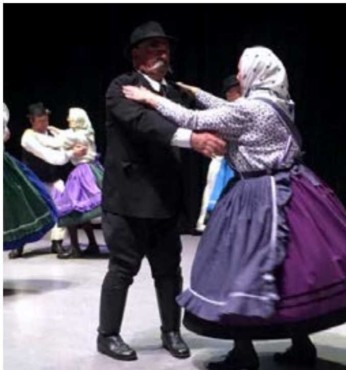
■ Dévaványai Táncok

The 40th Western Canadian Hungarian Folk Festival will take place from October 5 through 8, hosted by the Victoria Búzavirág Hungarian Dancers. We have already begun making arrangements for the hotel, theatre, band(s), and guest instructors. A festival of