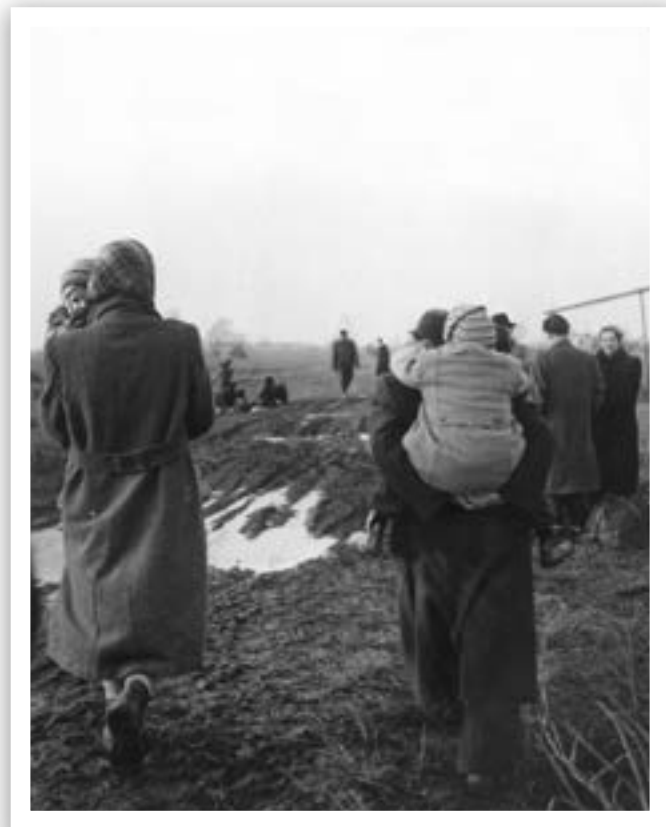
■ Ata Kandó: Menekültek az osztrák-magyar határon, 1956. Ata Kando / Nederlands fotomuseum

menekültekről, elsősorban a gyermekekről. A karácsonyra kiadott fotóalbumokból származó teljes bevételt a magyar menekült gyermekek megsegítésére ajánlotta fel. Napjainkban fotói a világ több gyűjteményében megtalálhatóak. Ata Kandó 1991-ben megkapta a Pro Cultura Hungarica kitüntetést, 1999-ben a Magyar Fotóművészek Szövetsége Életműdíjjal ismerte el munkásságát. Élete utolsó szakaszában az Amszterdamban közeli Bergenben élt. 2017. szeptember 14-én, 104. születésnapja előtt pár nappal hunyt el. ❖