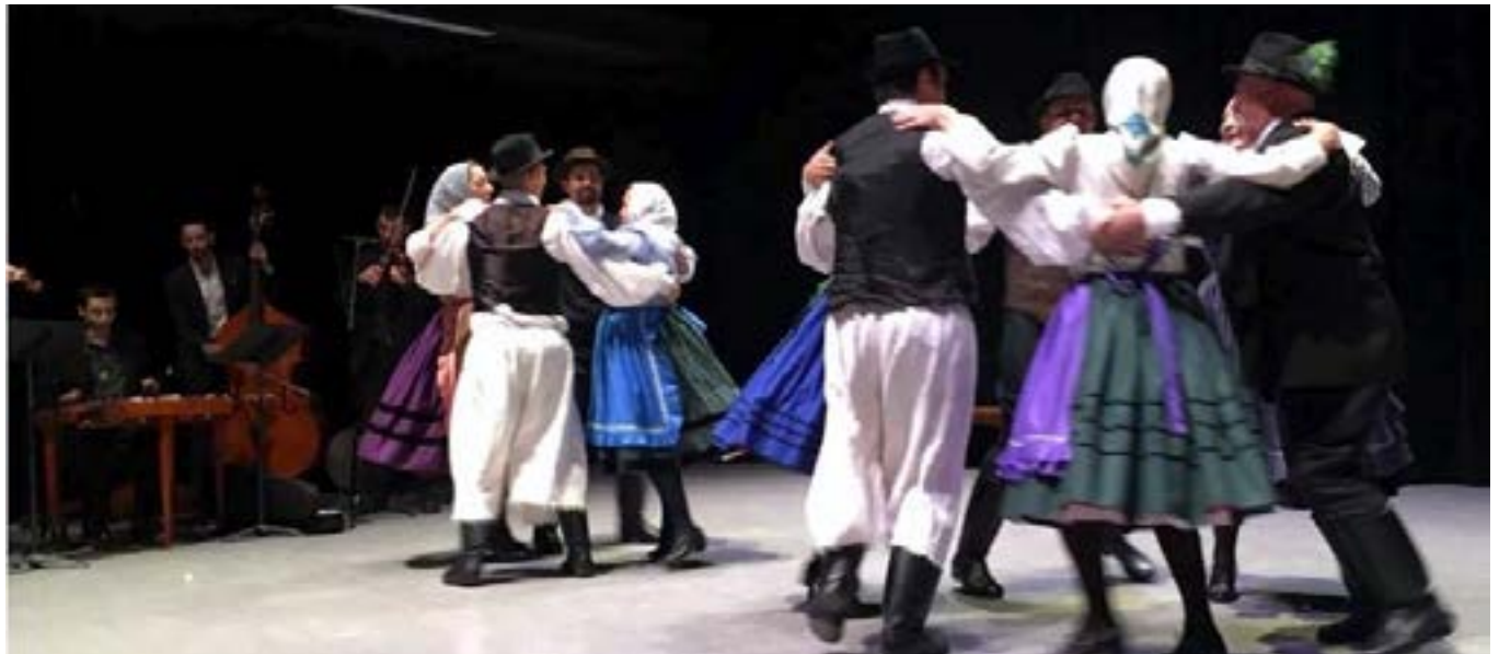
■ Dévaványai Táncok