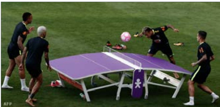
■ Jesus és Alves ellenfelei: a fejlő Neymar és az összpontosító Coutinho.

Teqball: a magyar találmány, ami egyre nagyobb népszerűségnek örvend világszerte. A láb-pingpongnek emlegetett játék 2014 nyarán indult útnak, magyar szabadalom, feltalálói Borsányi Gábor és Huszár Viktor. A játékot egy speciális asztalon játsszák, amit teqboardnak neveznek. A találmány iránt egyre több komoly futballcsapat is érdeklődik, hiszen kiváló kiegészítője lehet a profi futballisták edzésprogramjának is, mivel fejleszti a játékosok technikai tudását, koncentrációs készségüket, valamint állóké-