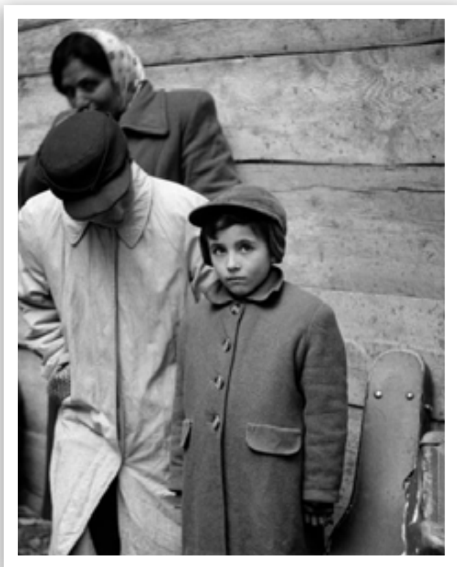
■ Eisenstadt, Ausztria, 1956. október.