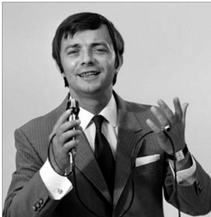
■ Aradszky László tánccdalénekes.

2017. október 8-án vasárnap este váratlanul elhunyt Aradszky László. Az előadóművész igen aktív életet élt, még aznap is fellépése volt. 1935-ben született Budapesten. Zenei karrierje 1963-ban kezdődött. A Magyar Rádió Tessék választani! könnyűzenei versenyén megosztott első helyezést nyert Még ide-oda húz a szív című dalával. 1966-ban a Magyar Rádió Made in Hungary hangversenyét az Isten véled édes Piroskám című versenydallal nyerte meg. Ő lett a magyar hanglemezgyártás történetének első aranylemezes énekes. Ötvenéves karrierje során sokféle fellépett, többször járt Kanadában, Amerikában és Ausztráliában. Aradszky László 82 éves volt. ❖