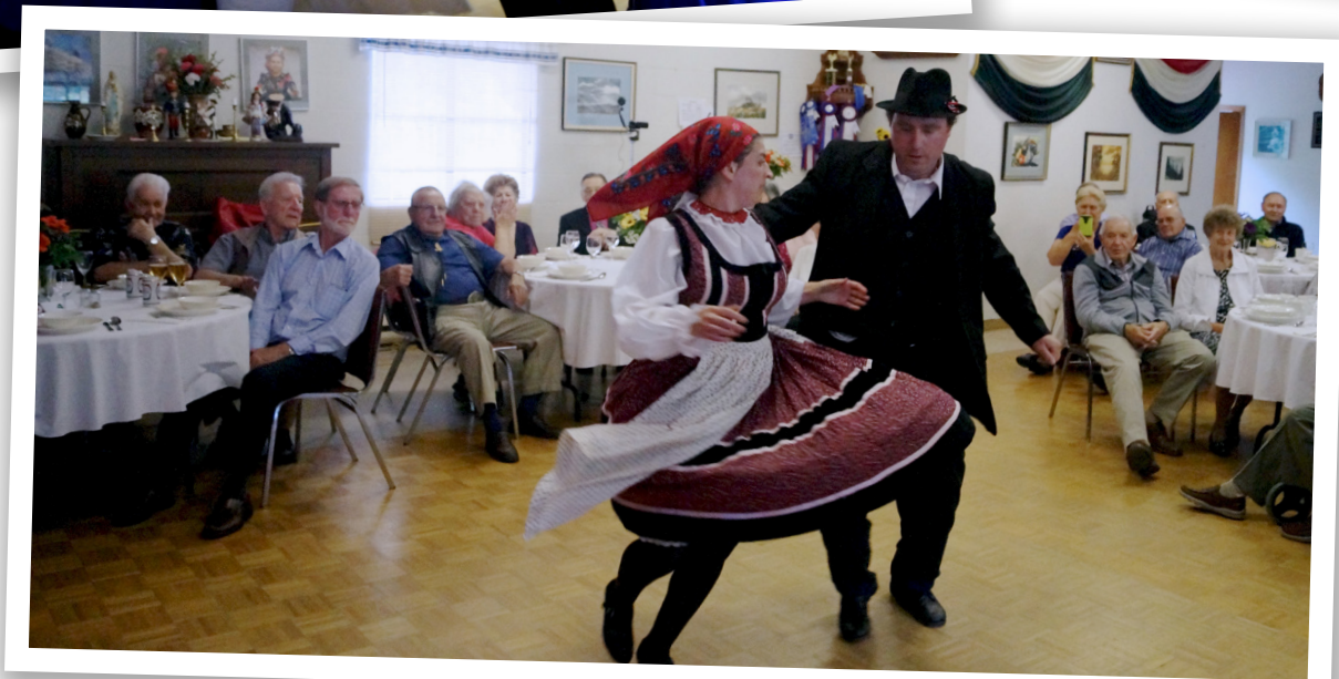
■ A Búzavirág táncsoport Nanaimóban