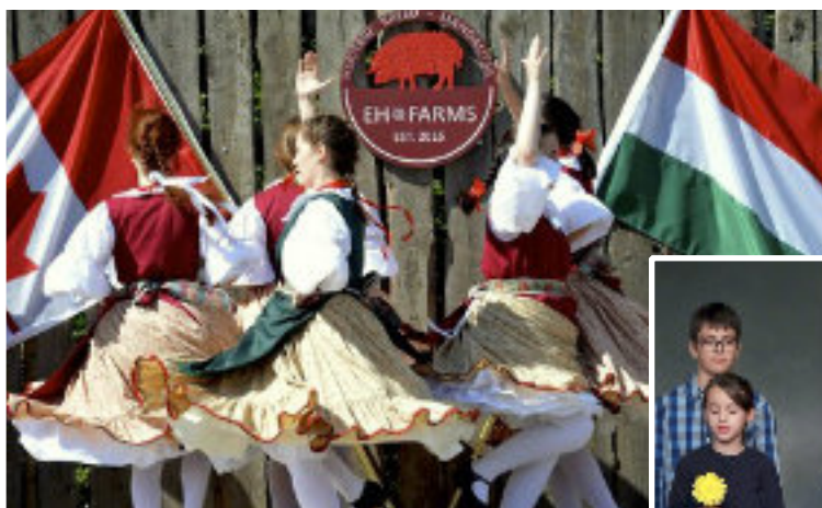
■ A Bartók gyermek néptáncsoport fellépése a II. Mangalica fesztiválon

Különleges program a havi rendszerességgel tartott Fonó-estünk, ahol képzeletben ellátogatunk egy-egy tájegységre és szó esik az adott település tánc kultúrájáról, zenéjéről, szokásairól. A program végén pedig magunk is kipróbálhatjuk az adott táncot. Kellemes hangulatban töltött közös program ez az érdeklődők számára.