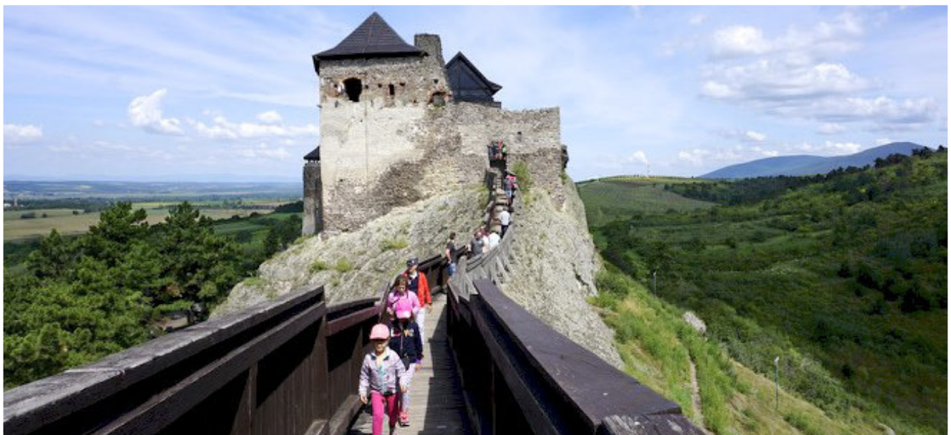
■ Fenn a várfokon