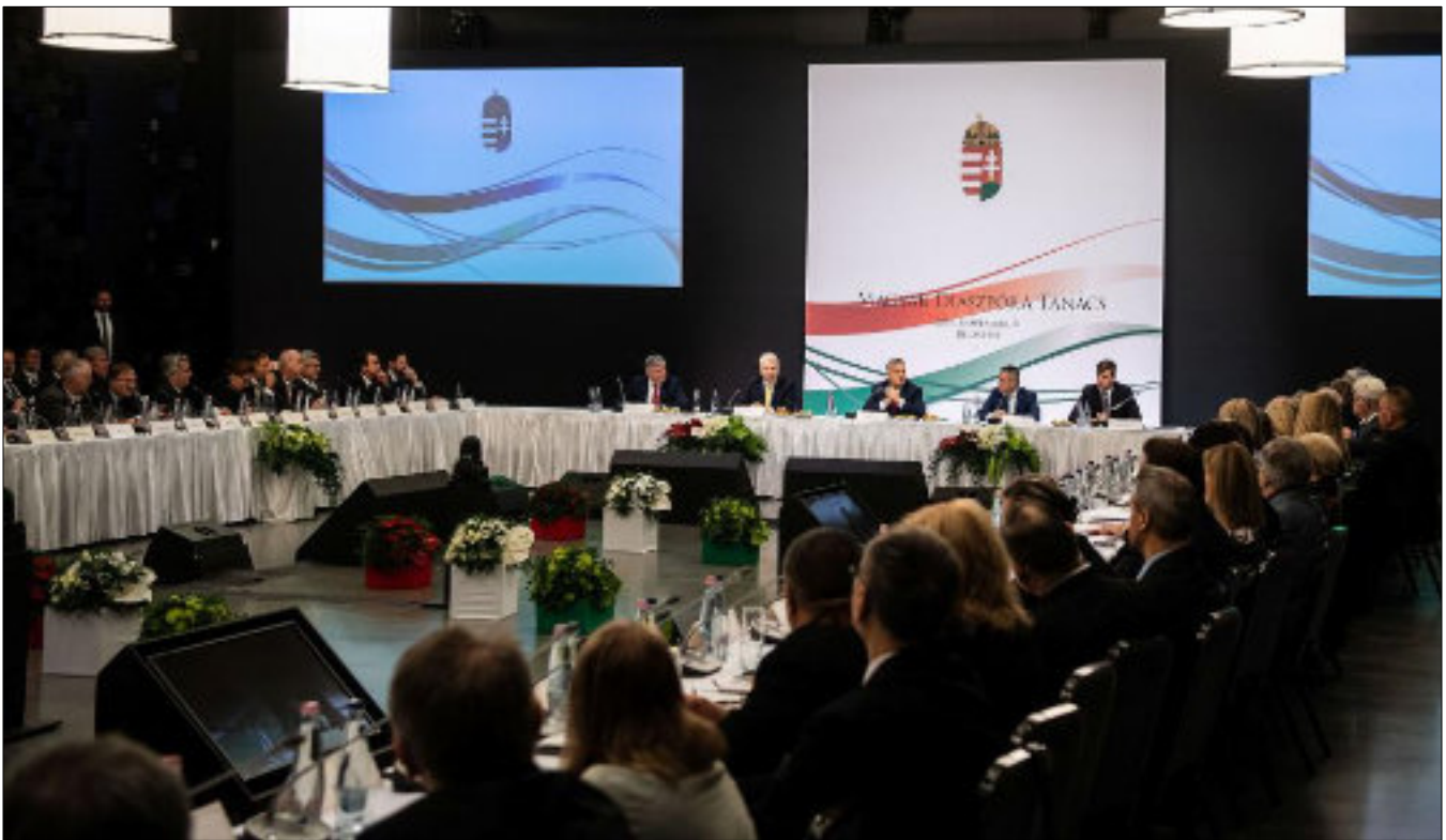
■ A Magyar Diaszpóra Tanács ülése Budapesten.

Sándor és a Petőfi Sándor Programot, a Mikes Kelemen Programot, továbbá a Julianus Programot és a Rákóczi Szövetség Diaszpóra Programját. A Kőrösi Csoma Sándor program 2013-ban indult 47 ösztöndíjossal, de számuk a Petőfi Sándor programmal kiegészülve mára már eléri a 225 főt. A közeljövőben új ösztöndíj-program is indul a Stipendium Hungaricum program kiterjesztésével. Ennek célja, hogy a diaszpóra magyarságának sokadik generációja lehetőséget kapjon tanulmányok