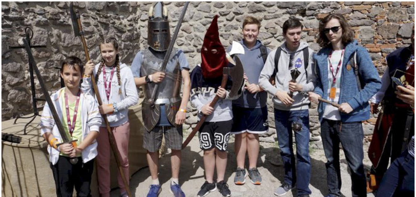
■ Talpig fegyverben