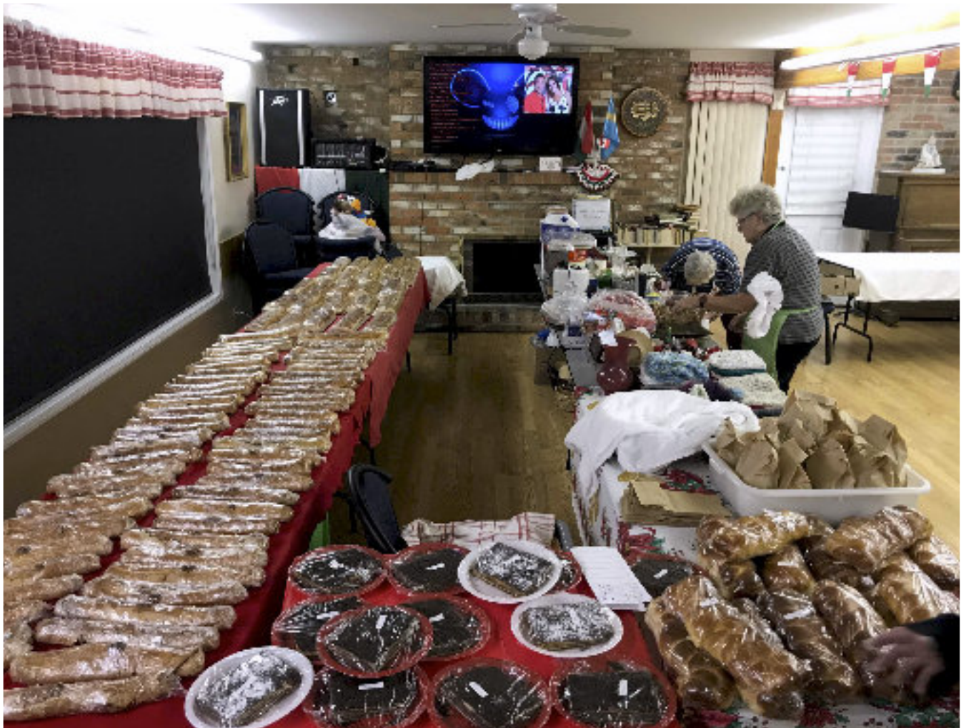
■ A karácsonyi bazár kínálata

műsortervezetünk, bálók és összejövetelek, jeles napokra szervezett ünnepek és bazárok. Működik Kelownán a Női kör, ők gondoskodnak minden alkalommal a vacsoráról. De a férfiak is besegítenek, egyre gyakrabban töltenek kolbászt és hurkát, hiszen a kereslet ezek a termékek iránt folyamatosan növekszik.