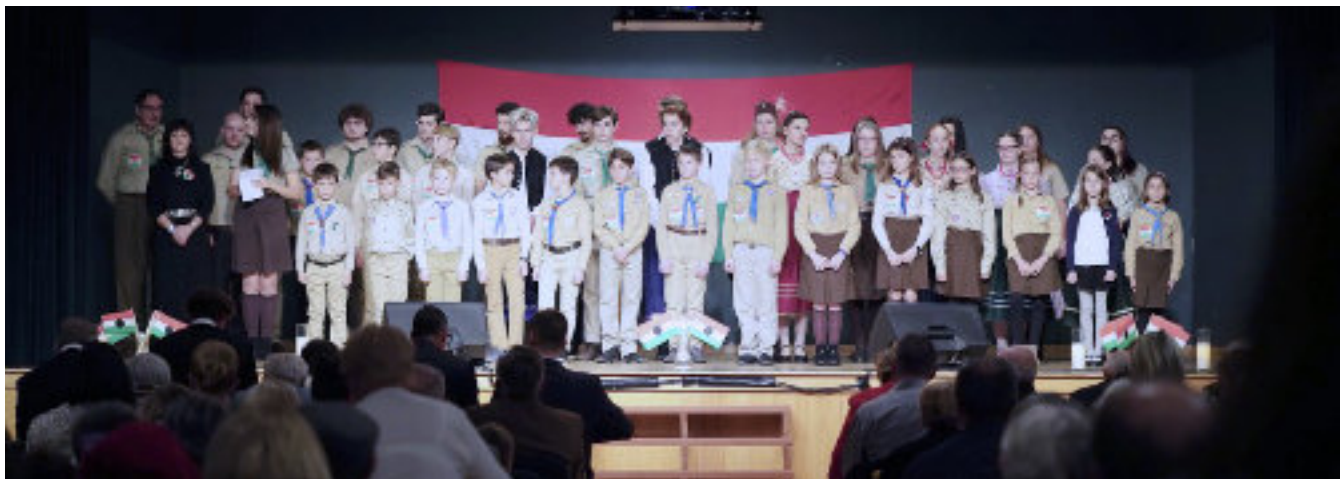
■ Calgary-i cserkészek az 1956-os ünnepi megemlékezésen

Az Egyesület programjain kívül szorosan együttműködünk a város többi magyar szervezetével. Például a házban helyet biztosítunk a táncpróbáknak, amikből nincs is kevés, mivel Calgary 3 magyar néptáncsoporttal is büszkélkedhet. A Bartók táncsoport és a Nádihegedű Magyar Népművészeti Műhely foglalkozik a legkisebbektől kezdve 18 éves korig a gyerekekkel és fiatalokkal. A Vadró-