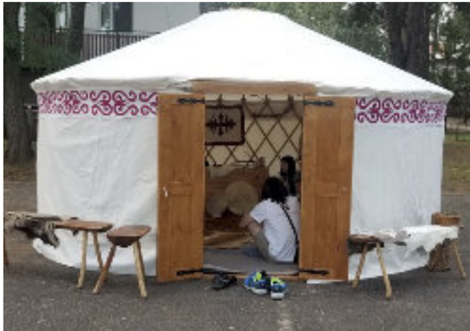
■ Jurta a táborban