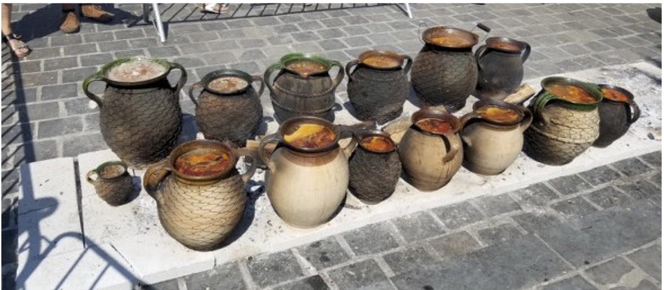
■ Mesterségek ünnepe - agyagedények