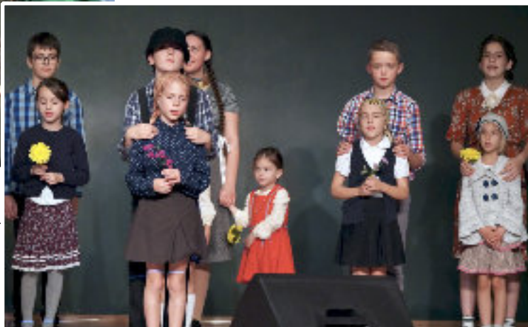
■ Nádihegedű Magyar Népművészeti Műhely előadása az 1956-os megemlékezésen

Kedvelt programnak számít az évről-évre ősszel és tavasszal megrendezett bazár a református és katolikus templom szervezésében, amelynek mindig nagy sikere van. Ezeket az eseményeket, többnapos előkészület előzi meg, ami-