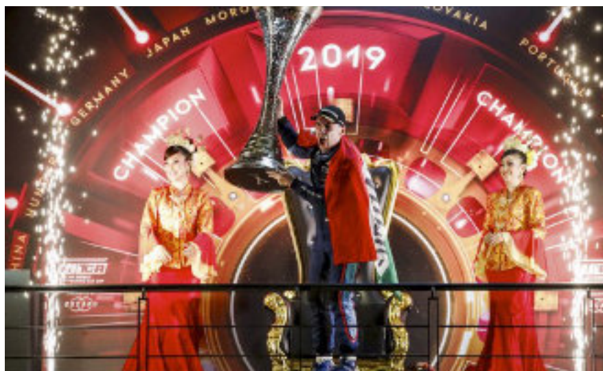
■ Michelisz Norbert öröme a kiérdemelt WTCR-serleggel.

Michelisz az idei szezonban 5 futamgyőzelmet aratott, mellette összesen kilencszer volt dobogós helyen, és végül 370 ponttal, 21 pontos előnnyel lett az egyéni pontverseny alapján világbajnok. Michelisz életében hosszú út és viszontagságos karrier veze-