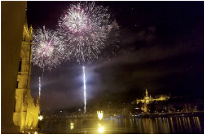
■ Augusztus 20. - tűzijáték

nepeltük, a Budai vár és környékén rendezett programokon vettünk részt. Ilyen volt a Mesterségek Ünnepe, Magyar Ízek utcája, parlamenti túra. A napot az ünnepi tűzijáték megtekintésével zártuk a Parlament Dunára néző lépcsőjéről néztük az attrakciót. Másnap reggeli után, fájó szívvel búcsúztunk vendéglátóinktól, kísérőinktől, az új ismerőseinktől és barátainktól. Összességében nagyon pozitív élményekkel tértünk haza. A gyermekeim tervezik, hogy visszatérnek a magyaror-