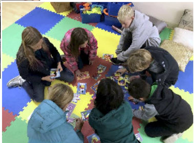
■ Foglalkozás a gyerekekkel

szolgáló helyiség falait is, amire az egyik ismert népmese mozzanatait rajzoltam – még 2016-ban. A felnövekvő generáción túl a felnőttekkel is foglalkozom, többen járnak hozzám magyar nyelvórára. Olyan férfiak és nők, akiknek vagy a párja magyar, vagy a nagy-