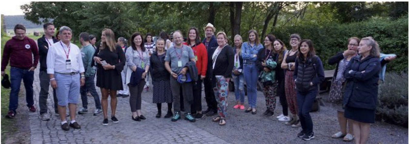
■ Pincelátogatáson együtt a kísérők és a szervezők

Megérkezésünk után, országok szerint bejelentkeztünk a táborba, ahol Rákóczi Táboros ajándécsomagot (hátizsák, szalmakalap, kulacs és azonosító névkártya) is kaptunk. Utána a kísérők a szállásunkra kísérték bennünket. A betonépületekben privát fürdőszobával ellátott 2 és 8 fős szobák vártak minket. A résztvevő diákokat a jelentkezés szerinti három (anyanyelvi, sport és néptánc) csoportba osztották be. Mindegyik csoport tagjait