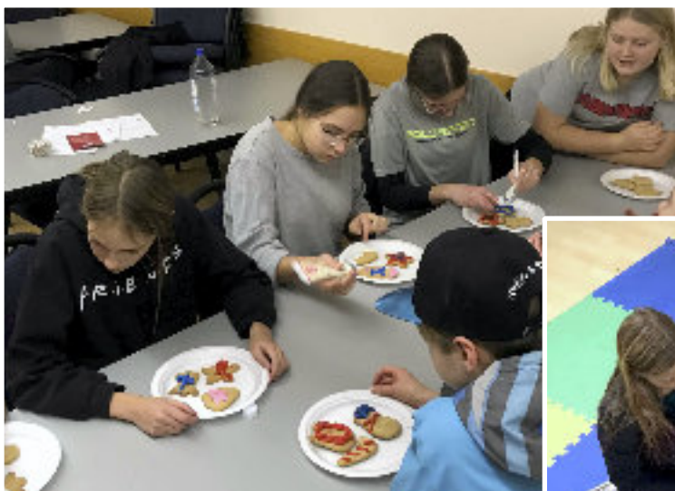
■ Mézeskalács sütés a gyerekekkel

szolgáló helyiség falait is, amire az egyik ismert népmese mozzanatait rajzoltam – még 2016-ban. A felnövekvő generáción túl a felnőttekkel is foglalkozom, többen járnak hozzám magyar nyelvórára. Olyan férfiak és nők, akiknek vagy a párja magyar, vagy a nagy-