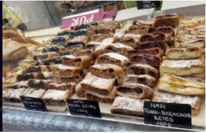
■ Magyar Ízek utcája - rétes

nepeltük, a Budai vár és környékén rendezett programokon vettünk részt. Ilyen volt a Mesterségek Ünnepe, Magyar Ízek utcája, parlamenti túra. A napot az ünnepi tűzijáték megtekintésével zártuk a Parlament Dunára néző lépcsőjéről néztük az attrakciót. Másnap reggeli után, fájó szívvel búcsúztunk vendéglátóinktól, kísérőinktől, az új ismerőseinktől és barátainktól. Összességében nagyon pozitív élményekkel tértünk haza. A gyermekeim tervezik, hogy visszatérnek a magyaror-