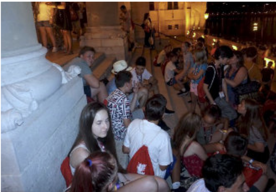
■ A Parlament lépcsőin a tűzijáték előtt

Az utolsó két éjszakát az ELTE kollégiumában töltöttük. Magyarország születésnapját, augusztus 20-át, egy budapesti egész napos kirándulással ün-