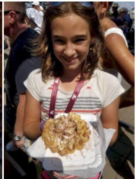
■ Finomság a bazárból