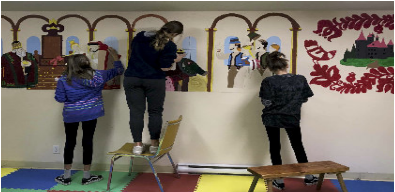
■ Magyar népmese a Magyar Ház falán

nek, ezért a gyerekek nem tudnak eljönni a Magyar Házba. Igyekszünk színessé tenni a programokat, az iskolán kívül a gyerekeknek szervezünk főzőiskolát, de a tanulóim festik a magyar iskola terméül