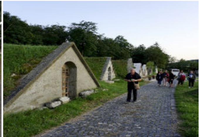
■ Sárospataki pincesor