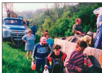
1993 Megérkezés Szent György pusztára