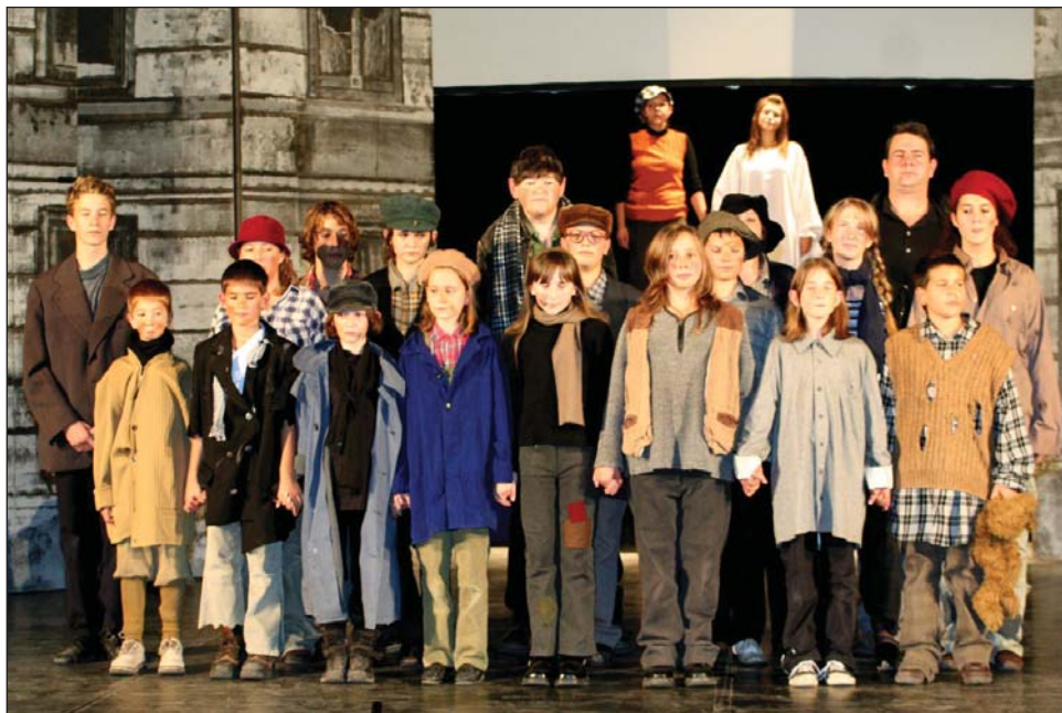
A gyúrói tábor, KOMISZ társulata

A "Jövőt Nekik is" Alapítvány és a Baptista Szeretetszolgálat Komédiás Integrált Színháza szervezésében szeretettel várunk minden kedves fiatalot (korhatár nélkül) az augusztusban megrendezésre kerülő színjátszó táborba.