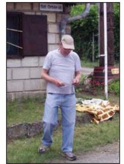
A borverseny sok aranyérmét hozott az öreghegyi gazdáknak