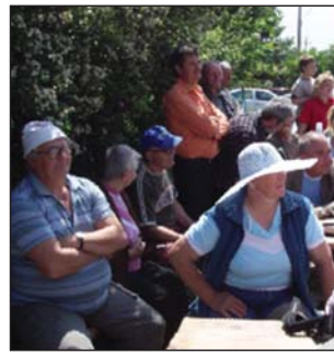
Idén is sokan voltunk az Öreghegy nagy napján

Befejezésül kívánt mindenkinek jó szórakozást, szüretre jó termést. Megköszönte a bizalmat, amire megpróbált rászorgálni, noha ez csak kis részében sikerült, és az új hegybírónak sok sikert kívánt.