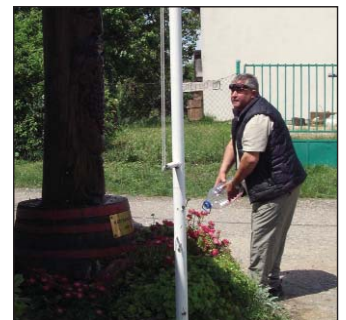
Az új Hegybíró, (a bő termés érdekében) borral locsolta meg Szent Orbán szobrát