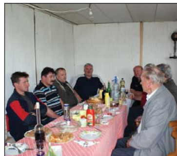
Bánki és szlovén vendégeink egy szép napot tölthettek az Öreghegyen