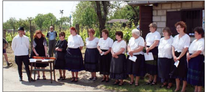
Frenetikus műsorral lépett fel a Tordasi Értékmegőrző Asszonykórus